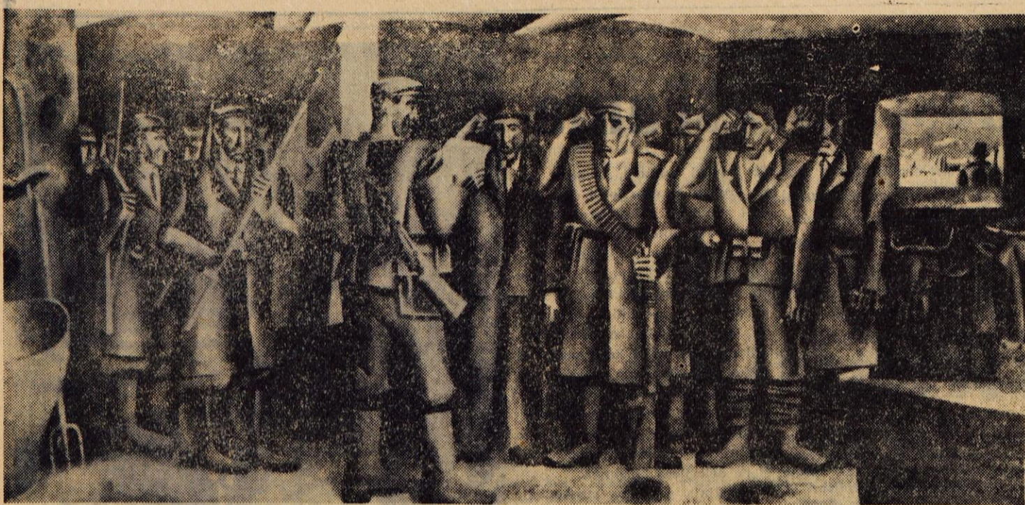
PARTIZANSKA ZAPRISEGA (Ive Subić, 1963), slika v PARTIZANSKEM DOMU na Vodiški planini, kjer bo v četrtek osrednja proslava ob DNEVU BORCA