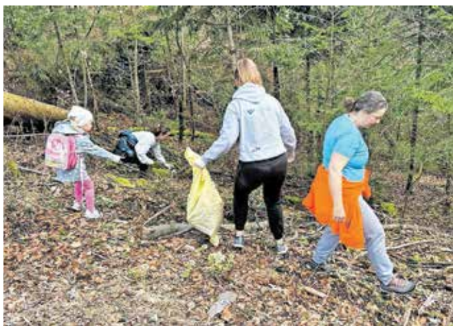
Spomladanska čistilna akcija temelji na medgeneracijskem sodelovanju prostovoljcev.

Duplica – V prvem sklopu spomladanskih čistilnih akcij so prostovoljci vseh generacij poskrbeli za urejeno in čisto okolico na petnajstih lokacijah. V duhu skupnega prizadevanja za lepši in čistejši Kamnik je Občina Kamnik tudi letos podprla krajevne skupnosti, društva, šole, upravne večstanovanjskih stavb in druge organizatorje čistilnih akcij. Zagotovila je potrebne pripomočke za uspešno izvedbo akcij, vključno z vrečami za odpadke, rokavicami za zaščito rok ter organizacijo odvoza zbranih odpadkov. Kot so pojasnili na Občini Kamnik, so se prostovoljci v krajevni skupnosti Duplica posvetili ne le pobiranju od-