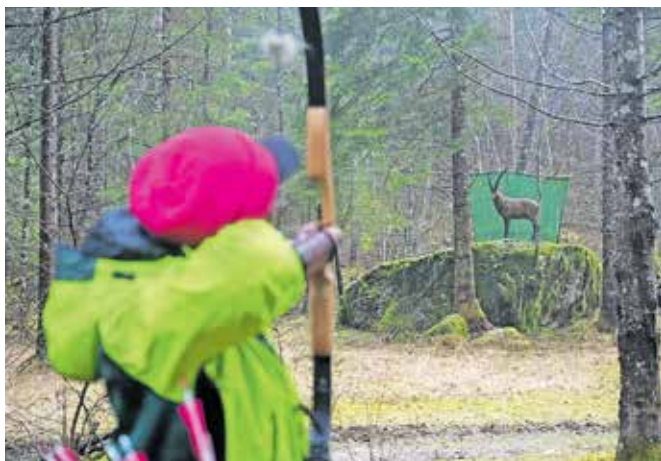
Tekmovanja se je udeležilo okrog sedemdeset lokostrelcev iz Slovenije, Hrvaške, Italije in Avstrije.

Lokostrelci tekmujejo v skupinah po štirje na tarčo. Po terenu je razvrščenih 28 tarč, ki so opremljene s številnimi in barvnimi količki, od koder se strelja na različnih razdaljah, odvisno od sloga in starostne skupine. Od belega količka streljajo najmlajši do 9. leta starosti,