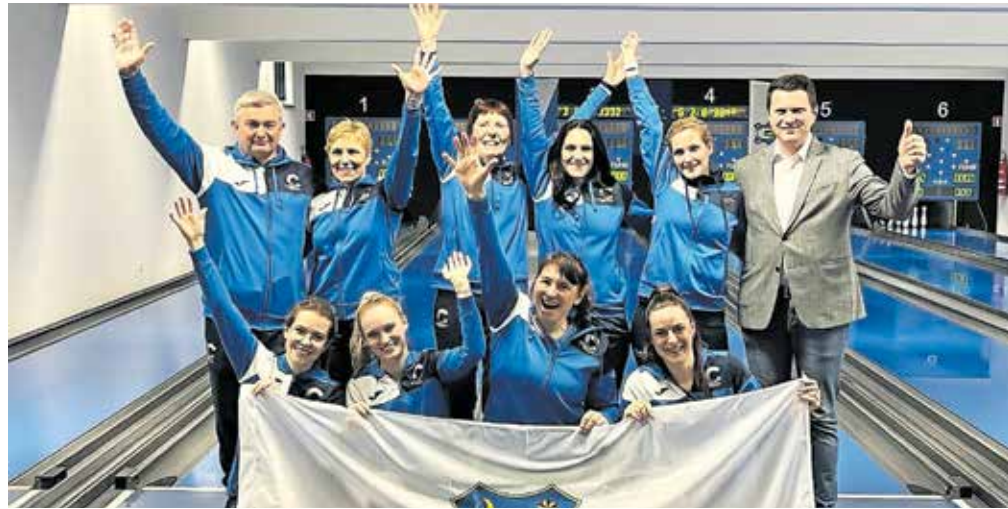
Kegljačice Calcita so celotno sezono dokazovale, da so najboljše.

Skozi celotno sezono so dokazovale, da so najboljše in jim ponovno osvojitve naslova lahko odvzame le poškodba kakšne izmed ključnih igralk. Na koncu so izgubile vsega dve tekmi, predvsem