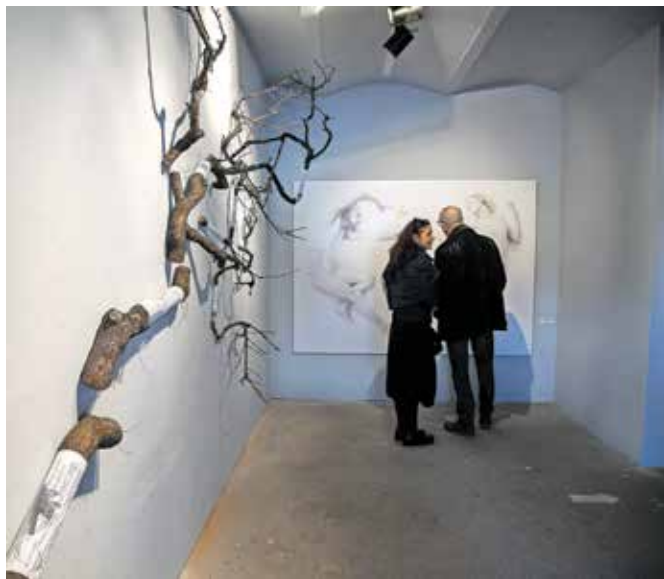
Na razstavah s svojimi deli sodeluje petindvajset avtorjev.