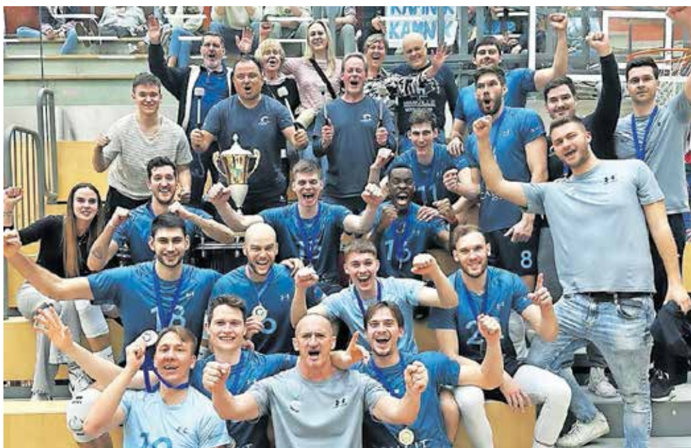
Zadovoljstvo ob prvi lovoriki kamniških odbojkarjev

»Upam, da bo to igralcem še povečalo apetite in da bomo šli v nedeljo po slovenski pokal v Koper, nato pa še po državno prvenstvo,« je še dodal izkušeni hrvaški strokovnjak na klopi Calcita Volleyja, ki si je pred zaključnim turnirjem