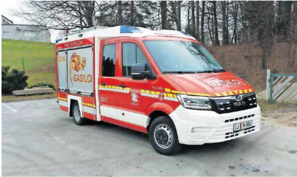
PGD Duplica je s pomočjo Občine Kamnik kupilo novo gasilsko vozilo GV-1.

Člani PGD Duplica si še nisimo dodobra opomogli in ni nam še uspelo zamenjati poškodovane opreme, ko so nas že prizadele katastrofalne poplave. Na srečo so bile na področju našega delova-