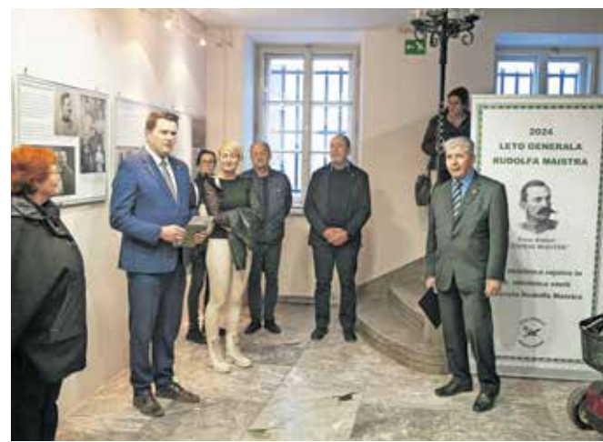
Odprtje razstave o generalu Rudolfu Maistru