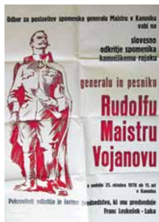
Plakat, ki je vabil na slovesnost ob postavitvi spomenika Rudolfu Maistru leta 1970 v Kamniku

Dandanes je spominjanja na Rudolfa Maistra, rešitelja Maribora in severne meje, kot ga najpogosteje imenujemo, v obliki spominskih plošč, doprskih kipov in monumentalnejših stvaritev že veliko. Je morda tovrstnega čaščenja znamenitega Slovenca preveč? Zagotovo ne, veljalo pa bi razmišljati in delovati tako, da pri vsem tem ne bi pozabili predvsem na spoštovanje do tega moža, ki naj se odraža tudi v kakovostnih in izvornih umetniških upodobitvah. V Kamniku na svojega generala niso nikoli pozabili, spoštovanje mu je mesto izkazalo tudi takrat, ko je bil odrinjen na rob ali celo čez rob slovenske zgodovine. Tako so mu že leta 1938, štiri leta po njegovi smrti, na