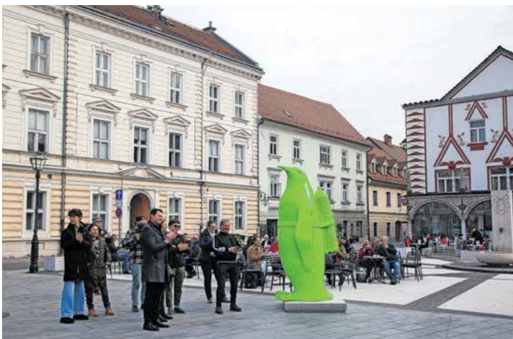
Zeleni pingvin na kamniškem Glavnem trgu