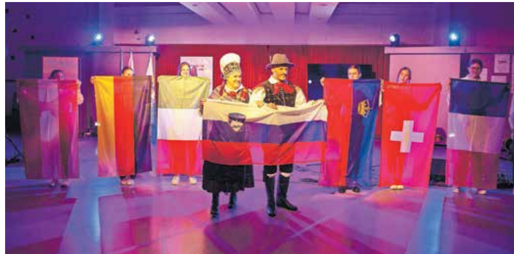
Slovesnost ob odprtju je potekala v avli Gimnazije in srednje šole Rudolfa Maistra.

Na uradnem odprtju, ki je prejšnji torek zvečer potekalo v prostorih kamniške šole, je kot slavnostna govornica mlade nagovorila tudi predsednica republike Nataša Pirc Musar. Poudarila je, da smo ljudje, ki živimo v tej