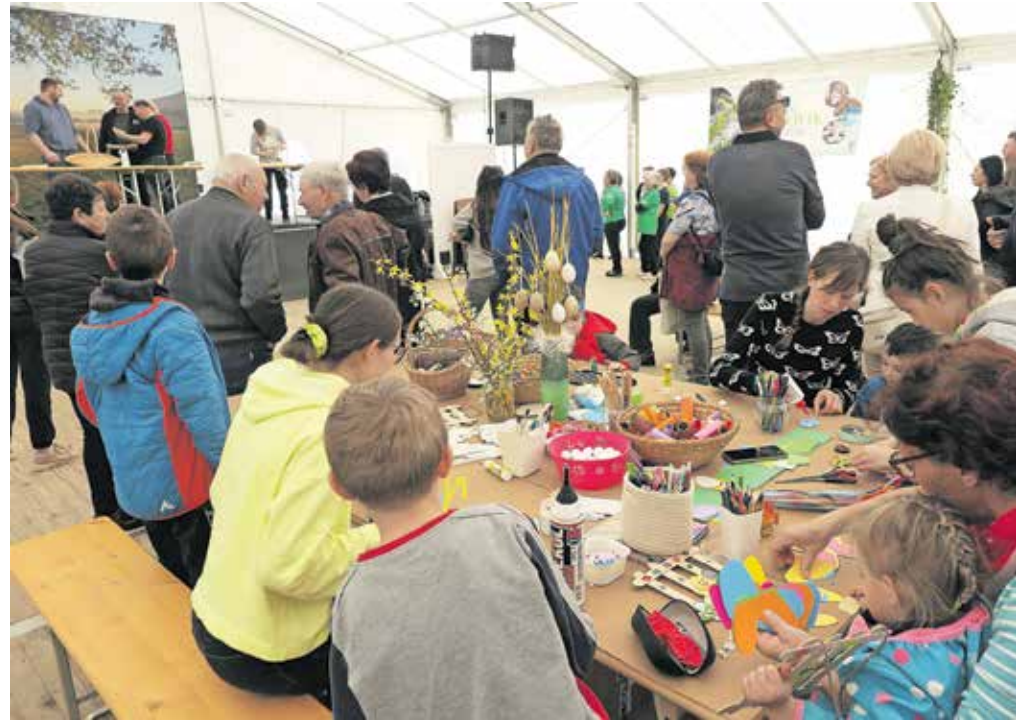
Kotiček z velikonočno delavnico

cem kaj pokazale, povedale o priznanjih in certifikatih, ki so si jih prislužile s kvačkanjem ali peko potice, domačim sirom ..., še bolj pa jih je razveselilo, če so tudi kaj prodale. Obiskovalci so lahko kupili vse od domačega kruha in potic do medu, domačih rezancev, lokalnih sirov