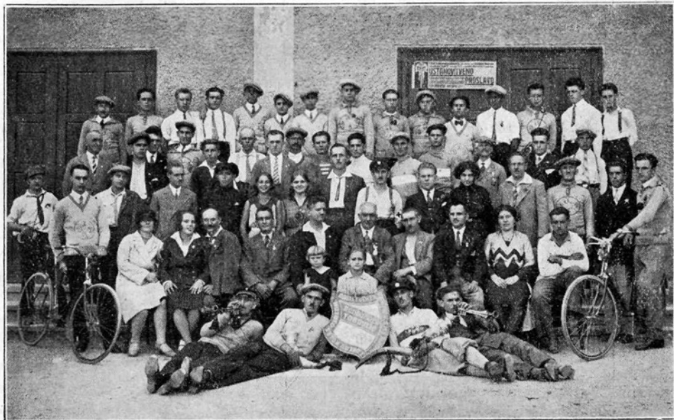
Delavski kolesarji iz Maribora, Studencev, Most pri Ljubljani in Trbovelj ob priliki prvega delavskega kolesarskega dneva v Trbovljah

Mladinski dom D. T. J. v Pragi. 28. in 29. junija tl. se je vršilo v Pragi krasno mladinsko športno slavje češkoslovaških delavskih telovadnih enot. 35.000 otrok in naraščajnikov iz vseh okrožij Češkoslovaške se ga je udeležilo. Dirkališče in so-