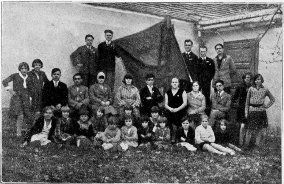
»Svoboda« v Studencih pri Mariboru ob 10 letnici

Dramatična sekcija pripravlja delavsko igro »Žrtve« za dne 16. in 23. novembra. Prvega decembra se vrši igra v Trbovljah.