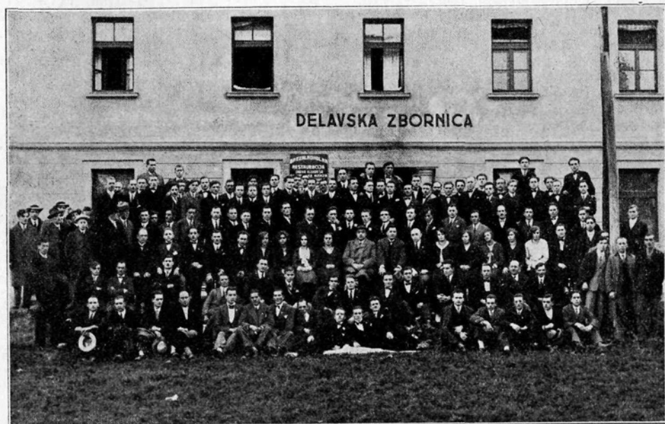
Člani pevskih zborov »Svobode« iz Celja, Maribora, Zabukovce in Hrastnika I (rudarji) ter Hrastnika II (steklarji) v Celju ob ustanovitvi pevske podzveze »Svoboda«