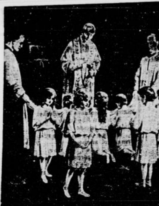
Pustite male k meni

In Jože je trenutno zagledal pred svojimi duševnimi očmi obraz stare čudaške grofice, ki mu je bila res naklonjena. Želel ji je vedno mlajši in pokoj.