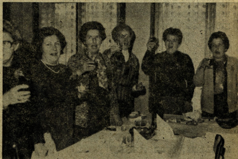
Tudi pri »Mlinarjevemu Janezu« je bilo veselo...

Po končani svečanosti so odšli naši upokojeni sodelavci in sodelavke k »Mlinarjevemu Janezu«, kjer jih je čakalo kosilo in prijetno medsebojno kramljanje o tem in onem.