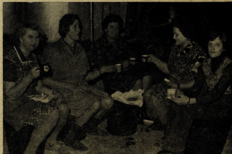
Tudi te naše sodelavke iz posode VI v emajlirnici so si privoščile zadnji dan dela v lanskem letu malo več počitka in kozarček ali »lonček« dobre kapljice.