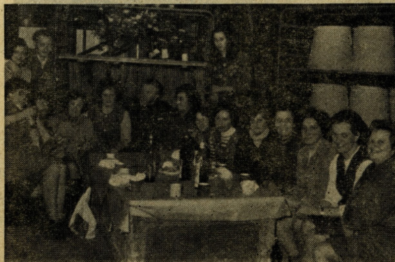
Zadnji dan dela se je zbrala ena od samoupravnih delovnih skupin na kratek odmor ter si privoščila prijeten klepet ob pričakanju zaključka dela.

überwachung an Gasverbrauchseinrichtungen. Zündsicherungen.