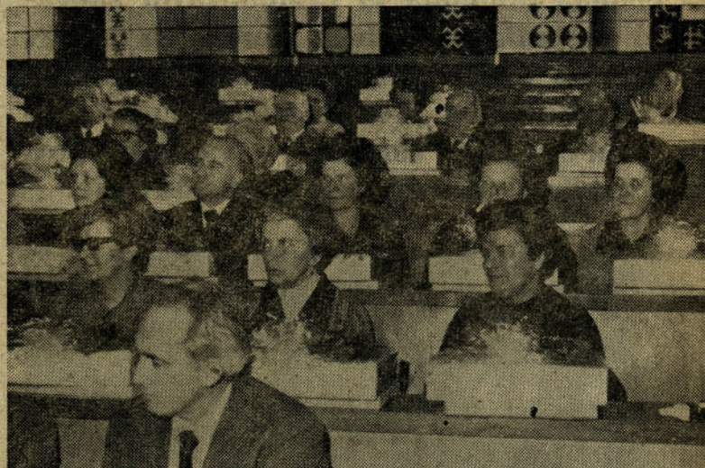
Upokojeni sodelavci in sodelavke so se zbrali v dvorani DS, kjer sta jih sprejela predsednica DS EMO in glavni direktor

Ob vašem odhodu v zasluženi pokoj se spominjate tako lepih kot težkih doživetij v dolgih letih dela. Prepričana sem, da so vam ostali v spominu lepi trenutki, ki ste jih preživeli med nami in da se boste tudi v prihodnje vračali k tem