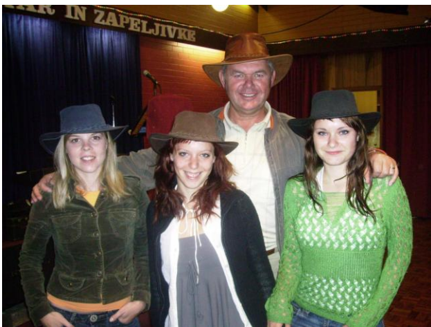
Zapeljivke in Boris z Akubra klobuki na glavi