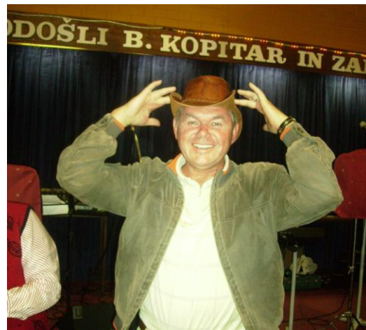
'A sem kaj fajn? Sem kar v redu, a ne?'