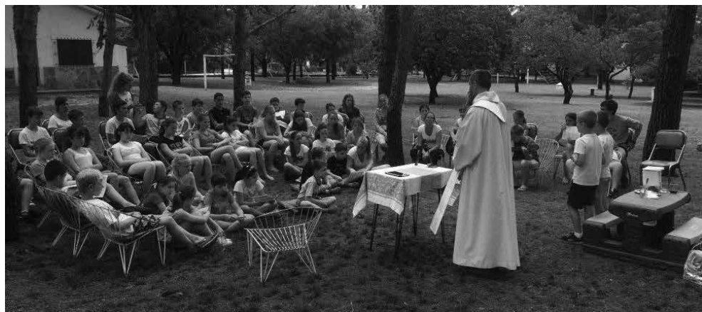
Maša v naravi

Vemo pa, da je za uspeh kolonije potrebno veliko truda! Zato omenimo tiste, ki so darovali svoj prosti čas