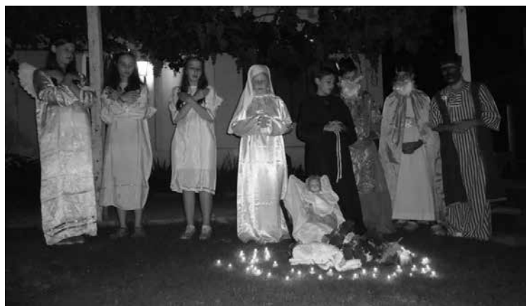
Prizor za sv. Tri kralje

»Kaj bomo delali jutri?« so spraševali najbolj nestrpni.