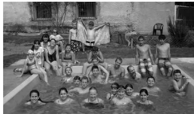
Veselo v bazenu

Deset dni hitro mine, če nas vsak dan čaka toliko lepih doživetij! Kar prehitro je 11. januar na koledarju že kazal dan našega odhoda. Težko nam je bilo, ko