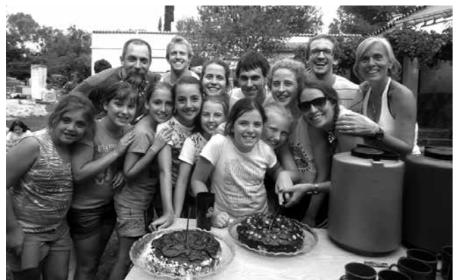
Tudi rojstni dan smo praznovali