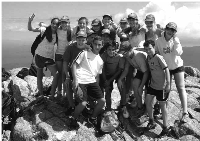
Osmošolci na vrhu gore Uritorco

Za vse nas je bila slovenska šolska kolonija nepozabno doživetje! Upamo, da jih bo še mnogo, da bodo lahko otroci tudi poleti gojili slovenski jezik in zdrava prijateljstva!