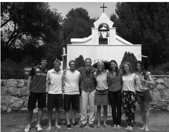
Voditelji, skrbni in veseli

Ker smo se na avtobusu dobro naspali in smo imeli veliko energije, smo se že tisto jutro odpravili spoznavat