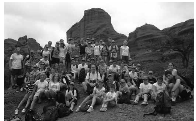
V okolici Los Terrones