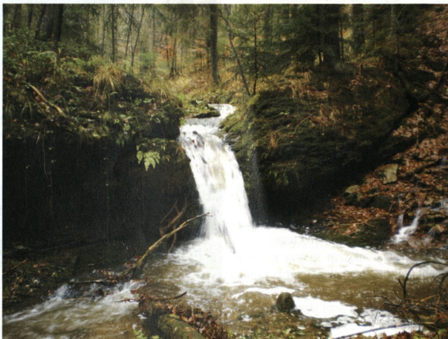
Slap na Račevi, pod Česnovim mostom