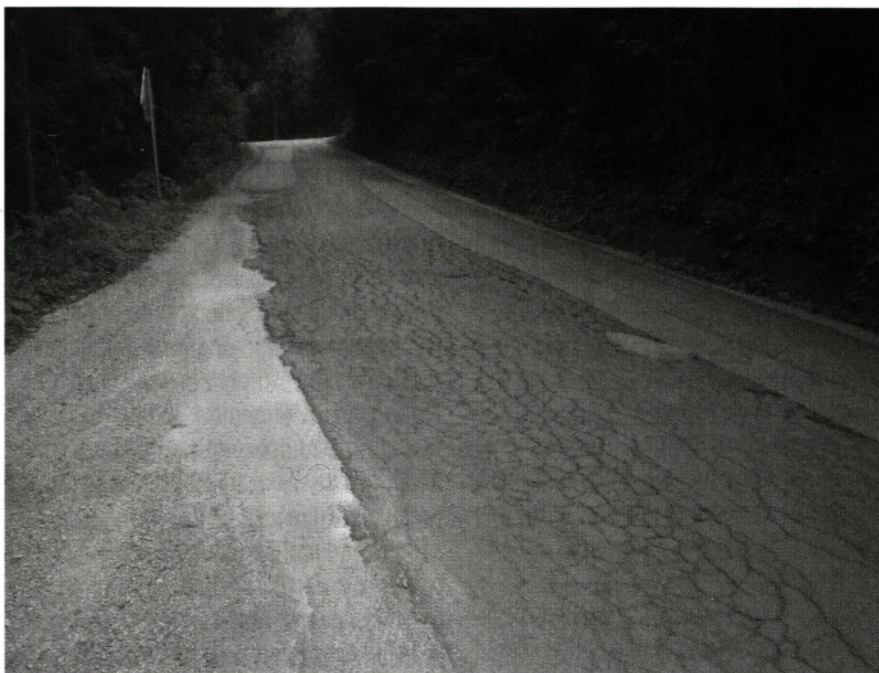
Cesta Smrečje - Podlesec naj bi v letu 2009 začeli obnavljati