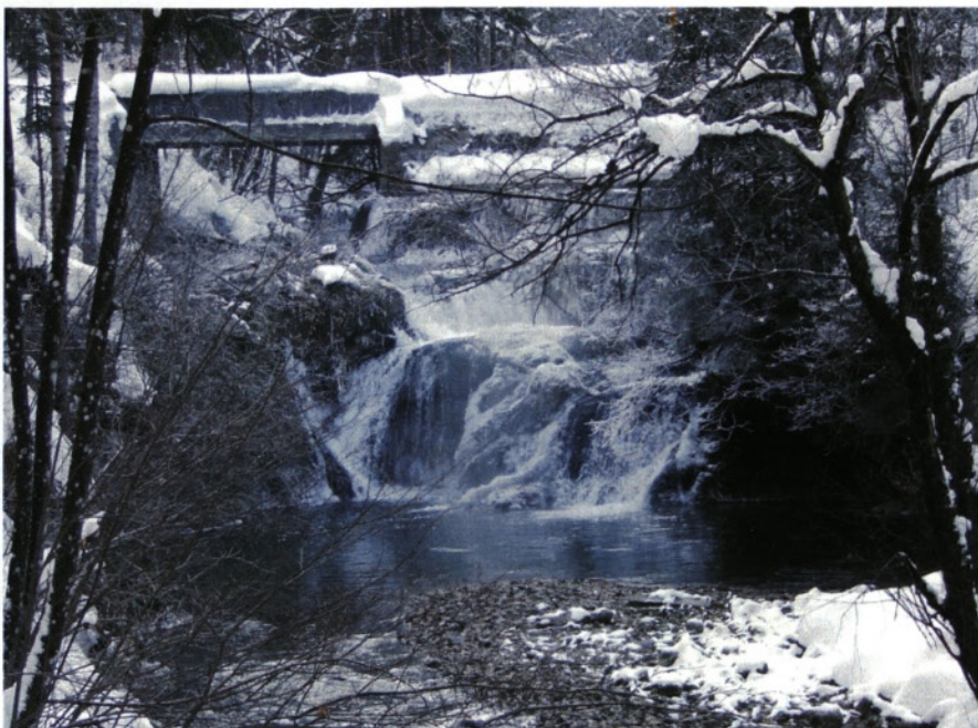
Slap v Sopotu

Njegova struga poteka mimo Piška, pod Vičičem, Maslcovimi senožeti, pod Zagrabnarjem na desni in pod Škratovcem na levi ter mimo Mežnarja, nakar se pod Pleskom steče v Maganov (Škratovcov) graben.