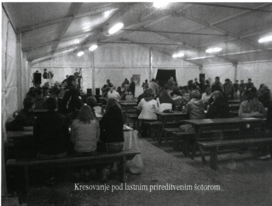
Kresovanje pod lastnim prireditvenim šotorom

Ko se je nezadržno približevala trideseta obletnica vrhovskega mladinskega in športno kulturnega druženja, sem se nehote vprašal, ali me je Vrh v vseh teh letih sploh potreboval. Vprašanje se je postavilo v tistem trenutku, ko sem v enem izmed pogovorov s članom generacije mladega vala naletel na nesimpatičen odnos. Pa ne samo na nesimpatičen, ampak celo na nestrpen odnos. V poglobljenih premlevaljih sem izluščil seme zla. Bolj kot moje (ne)delo v preteklosti »ga« moti predvsem moja prisotnost v zdajšnjem sklicu po volitvah. Četudi le v nadzornem odboru. In takšno razmišljanje posameznika se je - mogoče - razraslo in razneslo kot plesen tudi na