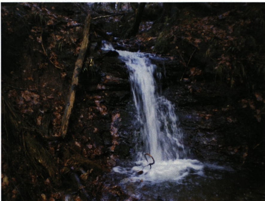
Slap na Breznem potoku pod Maslcem

Kmalu pod Piškom je v višini dobrih treh metrov lep strmi potok, precejšnjega naklona. Nekaj metrov nižje je pravi slap. Voda se poganja čez skalo v tolmun, vendar višina ni pretirana. Meter in pol.