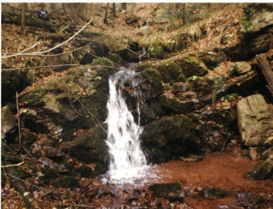
Slap v Bahačevih Brejgah pod Škrbinetom