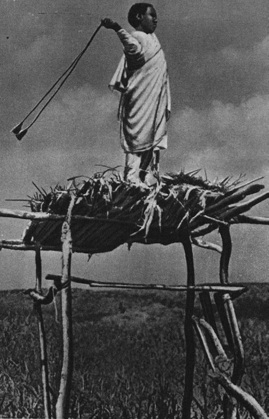
Zamorček odganja škodljive ptice,