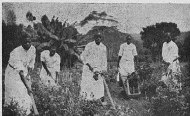
Zamorski semeniščniki pomagajo tudi na vrtu.