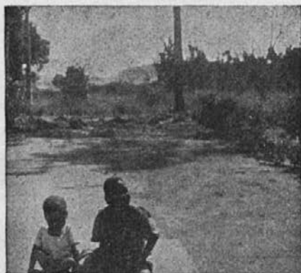
Te dve zamorski siroti smo pobrali kar na cesti.