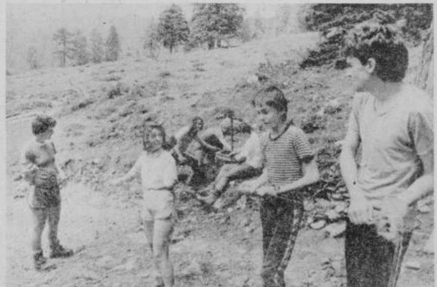
Udeleženci so ohnavljali planinske pašnike.