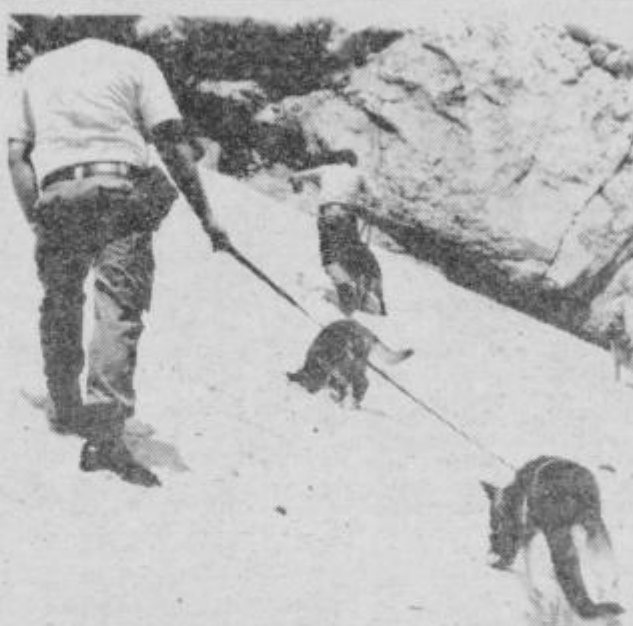
Na snežišču pod Savinjskim sedlom

sec in skupne vaje, ki jih pripravijo vodniki enkrat na mesec. Zadnja takšna vaja je bila na Okrešlju, kjer so psi iskali predmete zakopane v snegu pod Savinjskim sedlom, se orientirali glede na strel, poleg tega pa je bil to tudi kondicijski preizkus, saj je pot do Okrešlja kar naporna za pse, hkrati pa