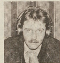
Pripravila: Iztok Jelacnik

Človek pa se le sprašuje, kako to, da ima vrsta umetnikov, novinarjev in komentatorjev na naši državni televiziji svoje stalno mesto. Nekateri pravijo, da gre pač za kvaliteto, drugi, da gre za klientelizem. Mi mislimo, da potrebuje vsaka ustanova nekaj nepremičnih točk, kot so v življenju ošpice, prehlad in druge nadloge.