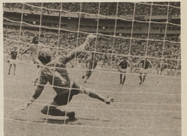
Tako je Brazilc Socrates iz 11-metrovke sinoči premagal poljskega vratarja

Sinoči se je poslovila še ena evropska ekipa. Brazilci so namreč visoko premagali Poljake (4:0) in še enkrat potrdili, da se njihova forma izboljšuje iz tekme v tekmo, kar jih vedno bolj uvršča med glavne favorite letošnjega svetovnega prvenstva.