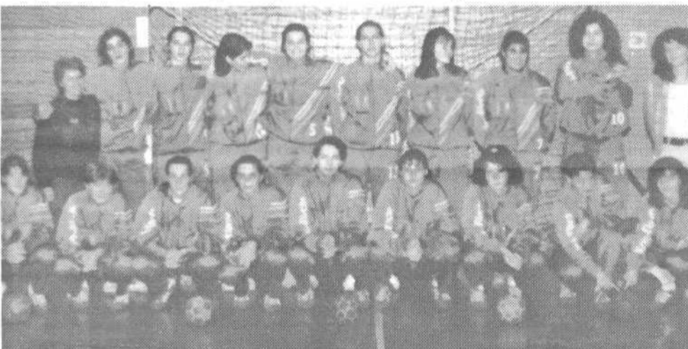
Zmagovita ekipa krimskih rokometošic

Igralke RK Krim Electa so nastopale v 1. državni ligi – modra skupina in zasedle prvo mesto. V končnici državnega prvenstva so se uvrstile v finale in zasedle drugo mesto. Kot lani pa so tudi letos osvojile naslov državnega prvaka v Pokalu Slovenije.