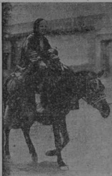
Sluka kitajskega begunca, ki beži pred vojnimi grozotami na severnem Kitajskem.