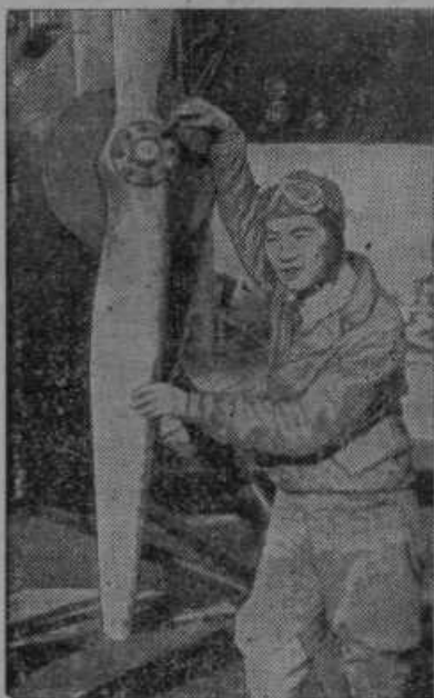
Mlad kitajski letalec, ki je bil izvežban v Ameriki.

Pariška razstava. Svetovno razstavo v Parizu delajo tako, da so si začeli ljudje voščiti takole: »Želim ti, da bi tako dolgo živel, da boš dočakal, da bo ureditev razstave v Parizu dogotovljena!«