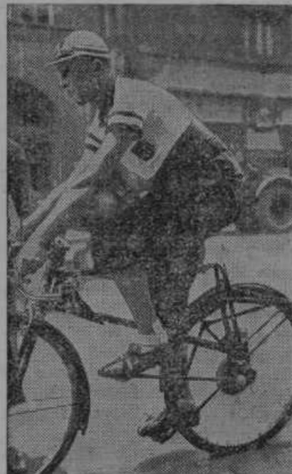
Dvokolo brez verige so izumili v Nemčiji.