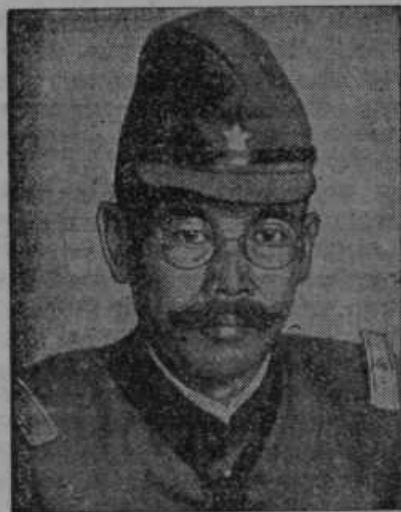
General Kacuki, poveljnik japonske armade na severnem Kitajskem.

Nismo proti! Sredi vročine je dobilo »Jutro« nehvaležno nalogo, da mora priti zamorca JNS in ga pred narodom zribati, da mu ne ostane madež, katerega je dobil o priliki glasovanja o konkordatu. Sedaj piše, da JNS ni proti, samo glasovali da so proti, drugače pa da so za kon-