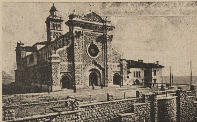
Nova svetogorska bazilika.

Hoja je od tam naprej hudo strma in sem šel zato s počasnim korakom. Bilo je okoli poldveh, noge so mi bile že močno težke. Molil sem žalostni del. Prehodil sem že bil tri četrtine poti. Sedel sem in dokončal zadnji dve "Zdravimariji". Sam sem bil, in vnovič mi je oživila misel na tisti čas, ko je Marija sama romala na goro. Videl sem jo. Koliko je morala pretrpeti, predno je dospela do tistega kraja, kjer sem jaz počival. Ona se ni ustavila; prebredla je z Jezusom v naročju, gosto trnje in pleplazila je špikasto kamenje. Vsa krvaveča, raztrgana in obnemogla se je naslonila na skalo, ki še danes stoji, da se odpočije za nadaljno pot, ki je bila še bolj naporna. Sama narava se je je tedaj usmilila in skala se je omeščala in dala Mariji udoben počitek. Spet je vstala in nadaljevala svojo pot, na skali pa kjer je slonela, je ostal odtisk njenega svetega telesa.