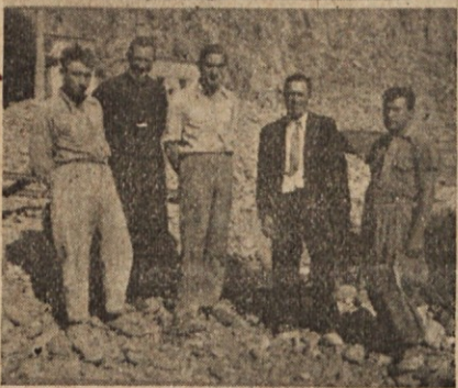
V Cacheuti med