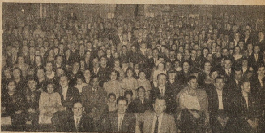
Pogled na vdeležence proslave v Berissu.

ko še v svojem življenju komaj 13, 14 pomladi štejejo. In tujina jih rada sprejme, ker so zale, delavne, in jih izrablja. Koliko jih pride nazaj, še mladih po letih, toda izdelanih, zastrupljenih. Za njih življenje nima več nobenih skrivnosti. Tudi so nekatera, ki pridejo z živo prtljago. Tudi izmed starejših, oženjenih ljudi jih gre mnogo, da se doma "duga" rešijo ali pa kaj spravijo. Za njih ima sezonsko izseljevanje poleg nekaterih dobrih posledic tudi mnogo slabih, ker naš človek je dober, vaje za delo, in zato premnogokrat postane žrtev izrabljanja in pokoplje svoje zdravje za vsikdar.