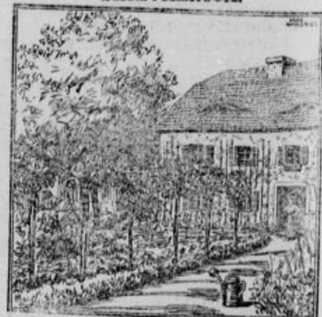
Kje je moja hčerka?