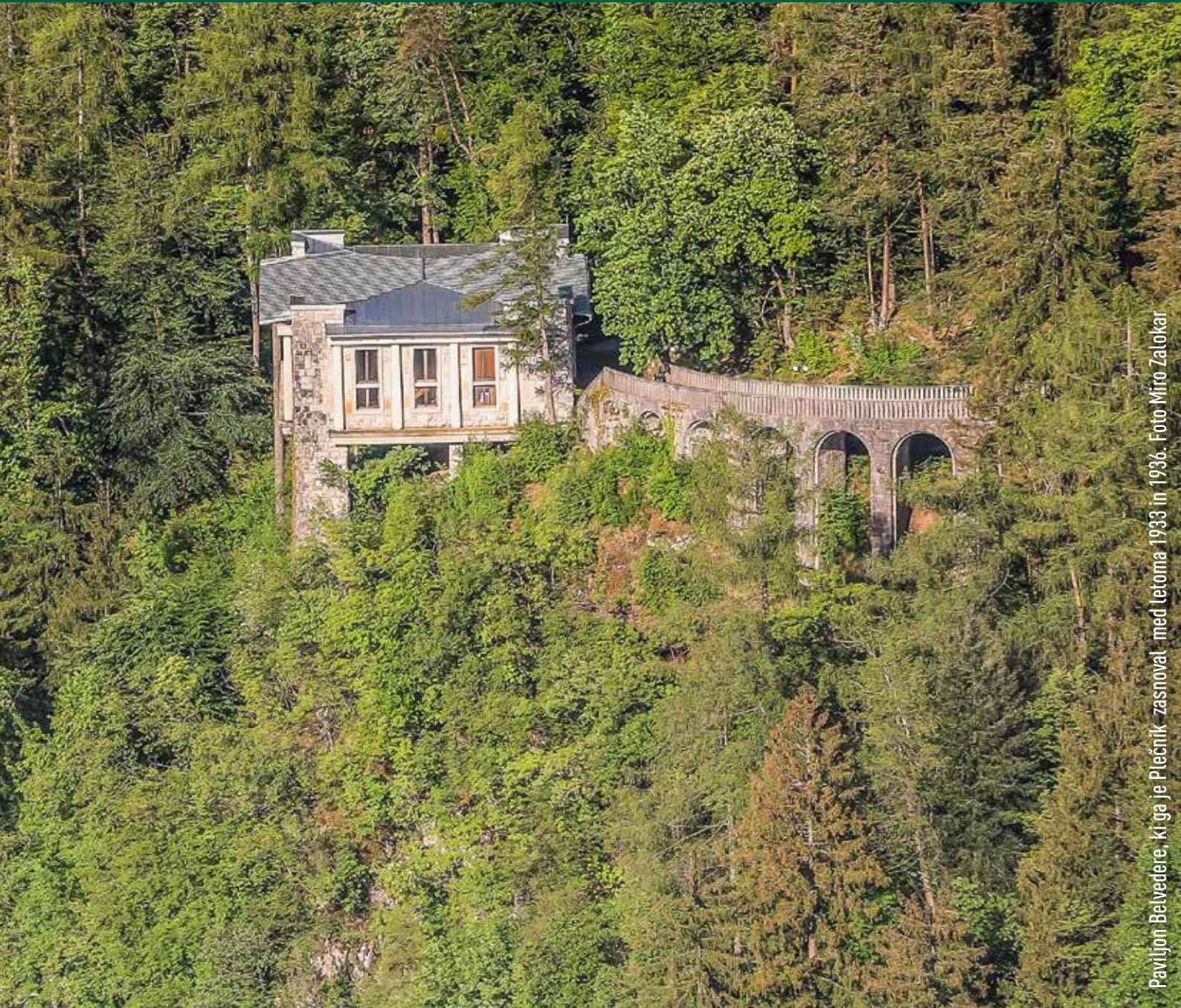
Paviljon Belvedere, ki ga je Plečnik zasnoval med letoma 1933 in 1936.