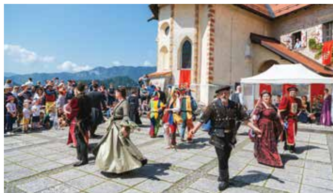
Srednjeveški nastopi na Blejskem gradu.

Ne samo na Srednjeveških dnevih, obiskovalke in obiskovalci Blejskega gradu si nastope srednjeveške skupine viteza Gašperja Lambergarja lahko ogledajo tudi v juliju in avgustu, vsak torek ob 17. uri na zgornji grajski terasi. Grad se takrat spremeni v prizorišče v družbi imenitnih gospodičen in pogumnih viteзов, njihovih lahkotnih plesov in prikazov mečevanja, ne manjkajo pa niti zabavni dvorni norčki.