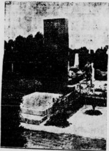
Magrobni spomenik gledališkega igralca Borštnika