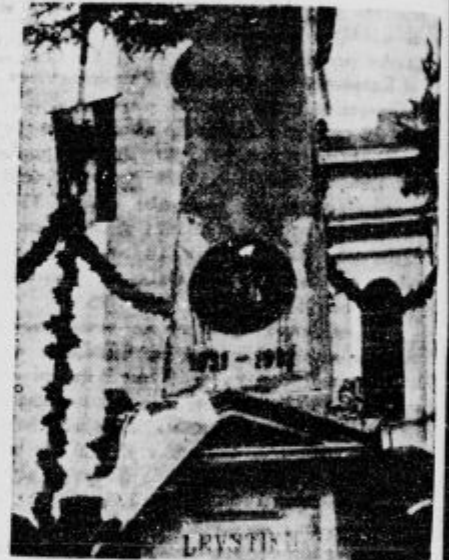
Lavstikov spomenik v Velikih Laščah