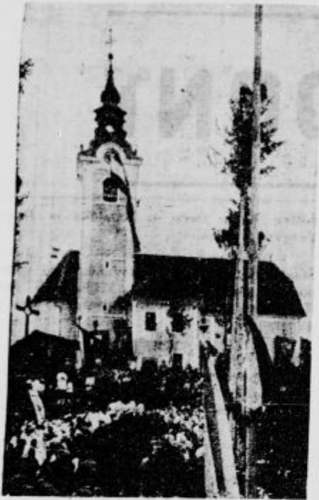
Evharistični stolp v Telaku