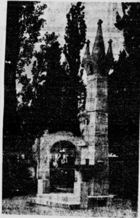
Spomenik vojnim žrtvam v Breznici