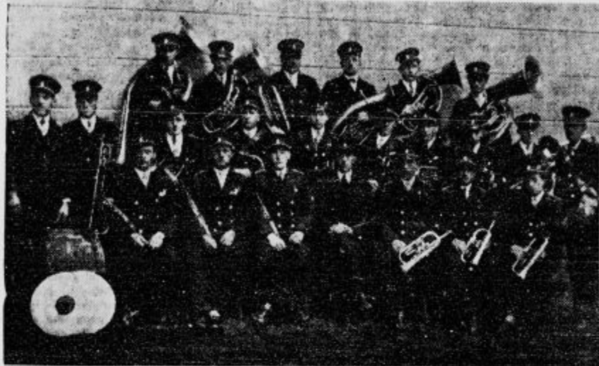
Cerkvena godba v Cerkljah pri Kranju