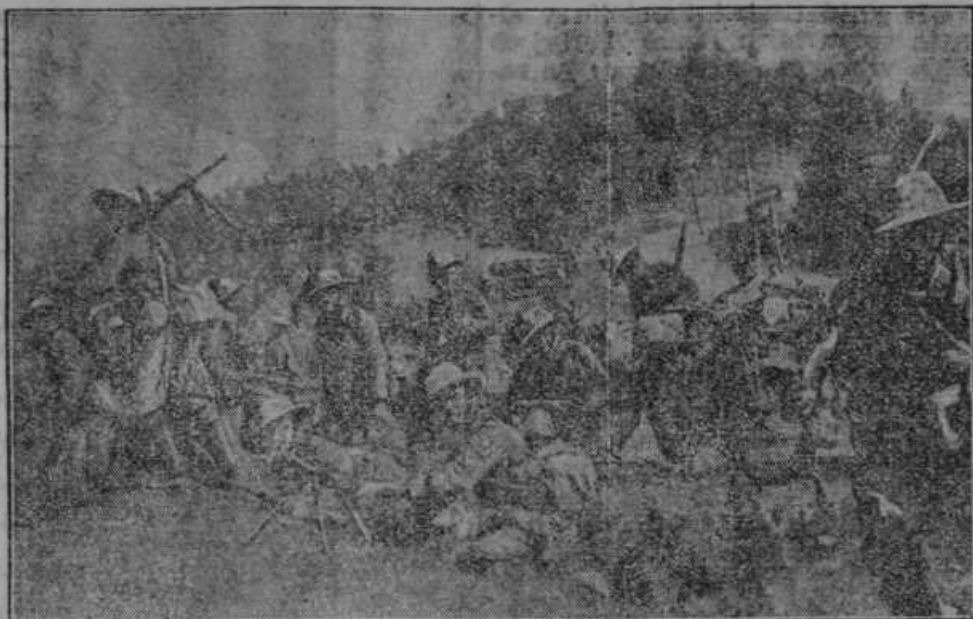
Motoriziran oddelek italijanskega vojaštva na manevrih.

Krog Njujorka je divjal tako strahovit vihar, da je ugasnil električno luč, katero drži v roki boginja prostosti. Kip je bil postavljen pred 50 leti in tokrat je prvič silovitost orkana premagala luč.