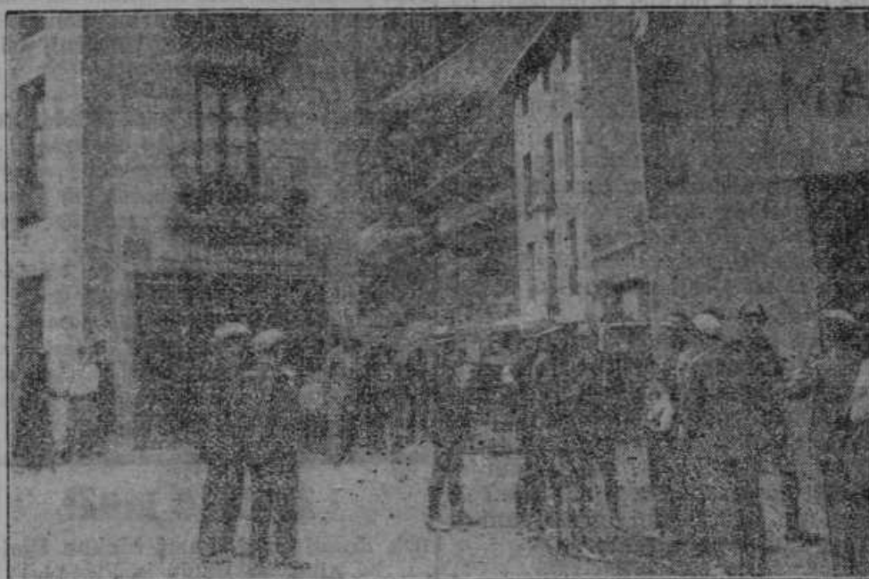
Majhno republiko Andoro (med Španijo in Francijo) je zasedlo radi notrajnih preprirov 200 francoskih orožnikov.