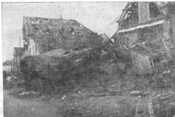
Levo: Take sledove je zapustila bliskovita vojna v Franciji — Desno: Tudi v Sedanu pušča vojna sledove, kakor jih vidimo na sliki

× Šola je povzročila spor. Slovensko društvo zobnih tehnikov je otvorilo v Ljubljani enoletno šolo za svoje člane, da bodo mogli na podlagi zakona pridobiti pravico izvrševanja svoje troke. Hrvaški zobni tehniki so vsled tega prekinili vse zveze s Slovenci.