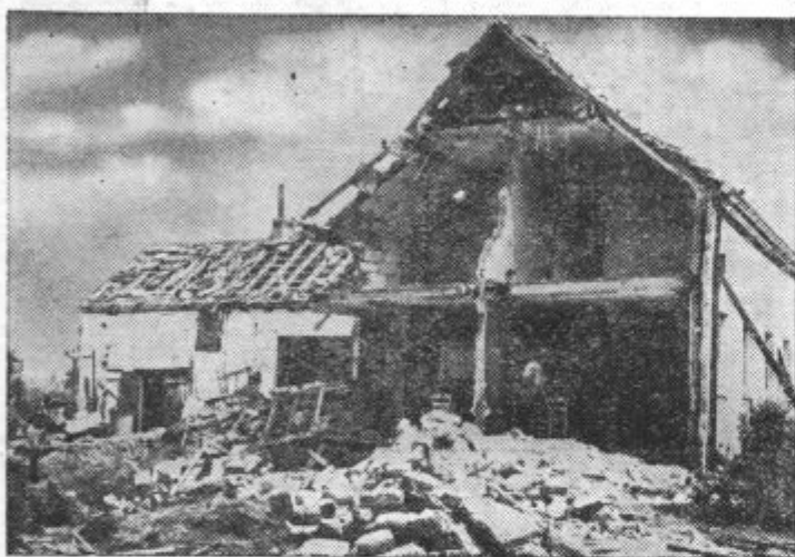
Levo: Takole slika povzroči angleški napad — Desno: Učinek bomb je zmeraj strahovit. Slika je posneta v Nemčiji