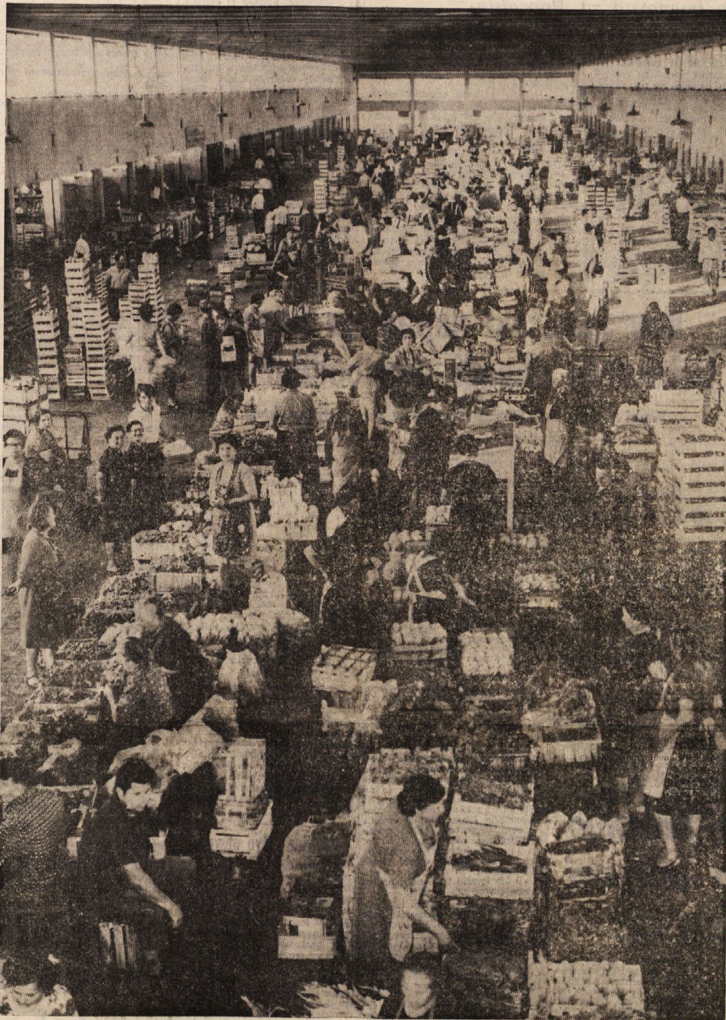
Pogled na glavno tržnico v Trstu, kjer prodajajo poljske pridelke naši kmetje