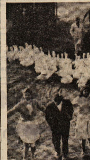
Slika iz filma Zbiralci perja (rež. Aleksander Petrović), ki je v Pulju dobil Veliko zlato areno. V Cannesu pa je dobil veliko nagrado žirije

— Melanje, zvišujem vam plačo za petdeset frankov na mesec. Ne da bi čakal zahvale, je vrnil v pisarno ter zapisal v zvezek, v predelku dobrih dejanj: «Sam od sebe sem za petdeset frankov povisil plačo služkinji Melanje, ki je pravzaprav deklica.» Ker ni imel nikogar več, ki bi mu lahko zvišal plačo, je odšel v nižje predele mesta, kjer je obiskal nekaj ubožnih družin. Stanovalci so mu z bojaznijo odpirali vrata in ga sprejemali s sovražno zadržanostjo, on pa jih je hitro miril in ob vohodu puščal bankovce po petdeset frankov. Ko je odšel, so navadno njegovi zavezanci spravili denar v žep in godrnjali: «Sta-