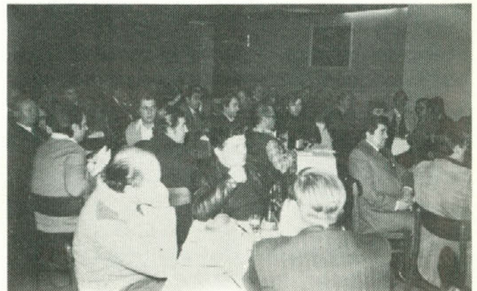
Udeleženci srečanja z zanimanjem sledijo uvodnemu poročilu.