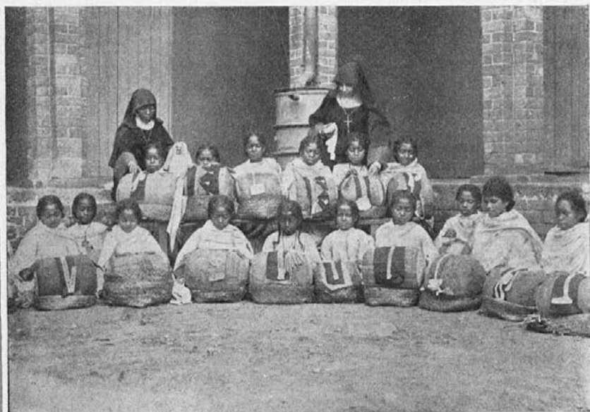
Sirotne deklice pri izdelavanju čipk (Madagaskar).