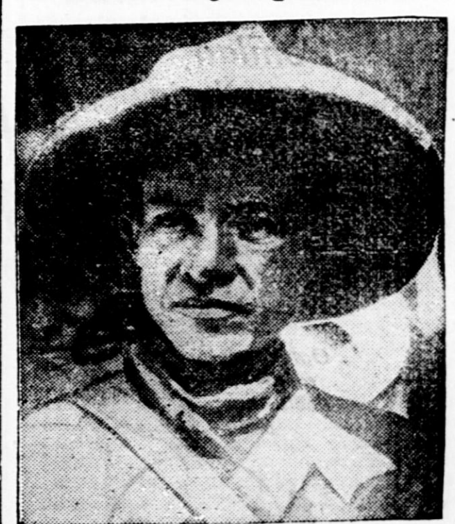
V Nikaragui so člani nacionalne garde umorili vodjo upornikov generala Samta.

Med spiritisti. — No, dobri duh, prikaži se nam. Če si tu, potrkaј enkrat, če te pa ni, potrkaј dvakrat.