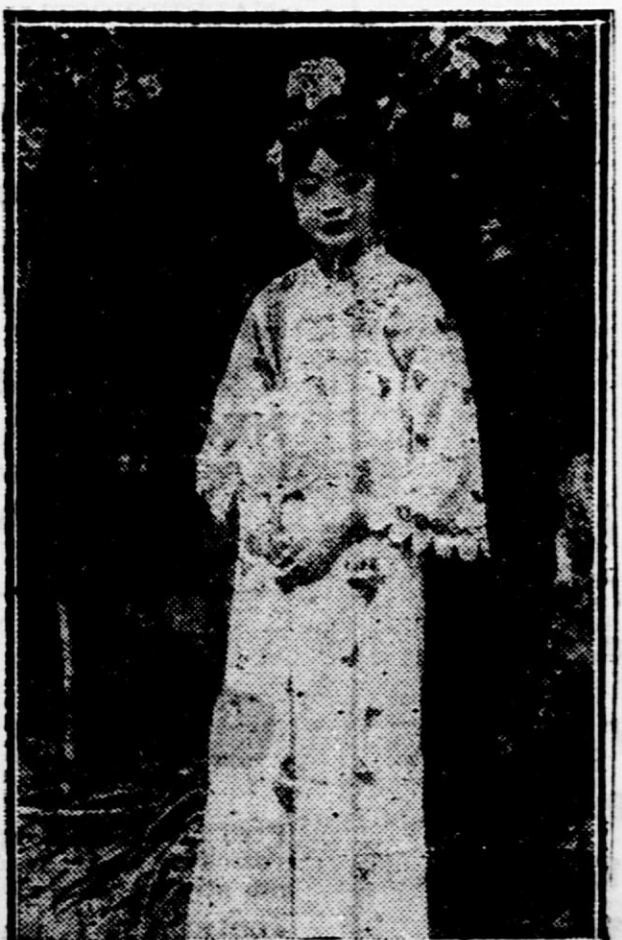
Gospa Henry Puyt, lepa kitajska princesa, soproga prezidenta nove države Mandžukuo, ki je postala zdaj cesarica