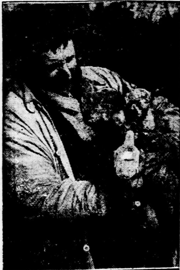
Na sliki vidimo jagenjčke, ki so izgubili mater, pa jih kmet hrani z mlekom iz steklenice.