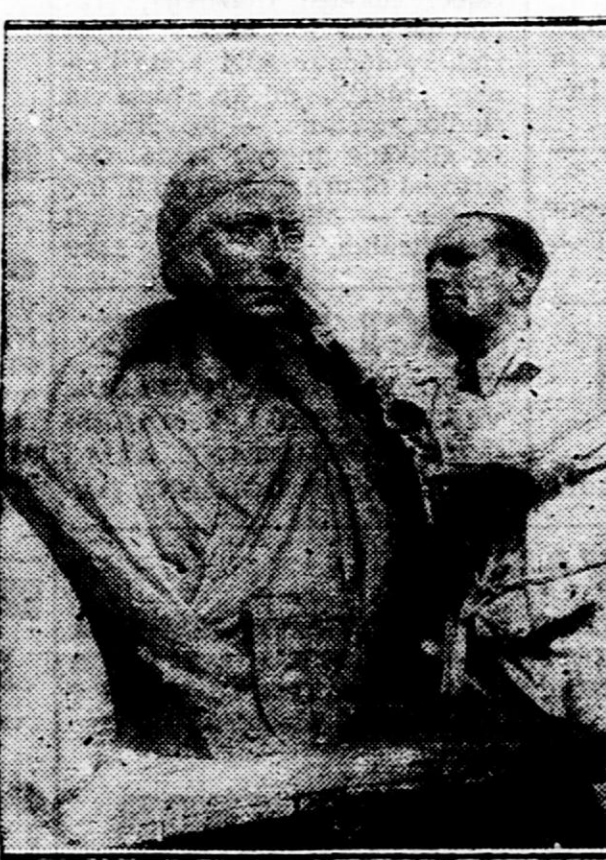
Kipar Pierre de Soets je izdelal prvi kip pokojnega belgijskega kralja, ki bo stal v vseh solah in javnih poslopjih.