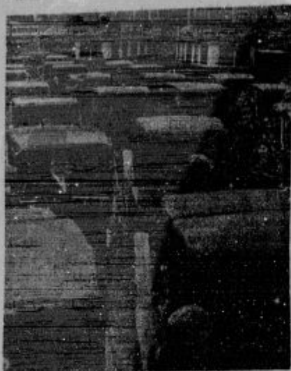
Tudi Dunaj stavka. Vsi avstrijski lastniki avtomobilov so napolnili današnje mestne ulice v znamenju protesta proti davku na bencin. Seveda je posilala vlada vojsko, ki je razgnala avtomobiliste. Pri tem je bilo mnogo aretacij.