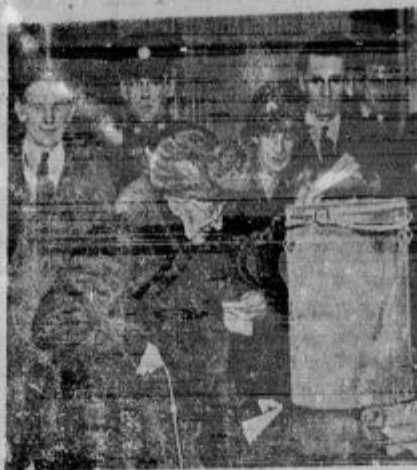
Ste osem let stara žena na volišču. Pri trkah v livilah, kjer je dobil de Valera absolutno večino, je oddala svoj glas tudi 108 let stara žena v Dušinu. Ta slučaj je gotovo edinstven.