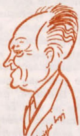
Predsednik slovenske ustavne komisije in republiške skupščine Sergej Kraigher je bil letos poleti izvoljen za častnega mesčana celjskega mesta.

Sedaj je na vrsti sprememba republiške ustave. Ustavna komisija je predlog sprememb že pripravila in ga dala v javno razpravo.