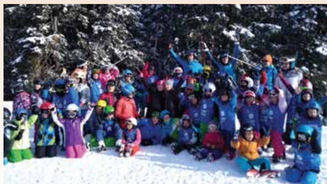
Vsi udeleženci smučarske šole na zimovanju SK Pivka na Kopah.