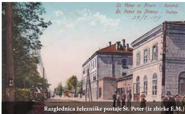
Razglednica železniške postaje Št. Peter