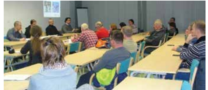
Javna razprava s prebivalci Občine Pivka (mala dvorana Krpanovega doma, 28. november 2017)

identifikacije problemov s strani prebivalcev so bile neurejene poti in pomanjkanje prometne signalizacije v okolici OŠ in vrtcev, neurejenost in pomanjkanje pločnikov, kolesarskih poti, prehodov za pešce, avtobusnih postajališč v celotni občini ter moteč tranzitni promet skozi manjša naselja v občini (državna cesta: Pivka-Knežak-Ilirska Bistrica). Na podlagi podanih identifikacij problemov bomo v nadaljevanju izdelave strategije zastavili cilje in na podlagi le-teh ukrepe.