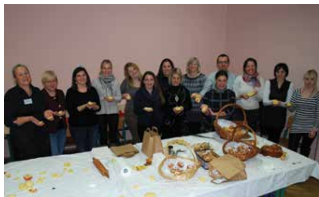
Andragoški zbor smo v prazničnem decembru zaključili poučno in ustvarjalno.