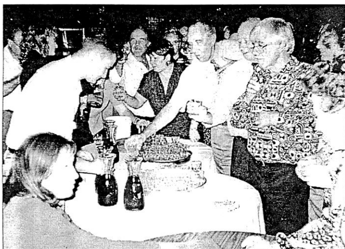
Pokušina vina na martinovanju