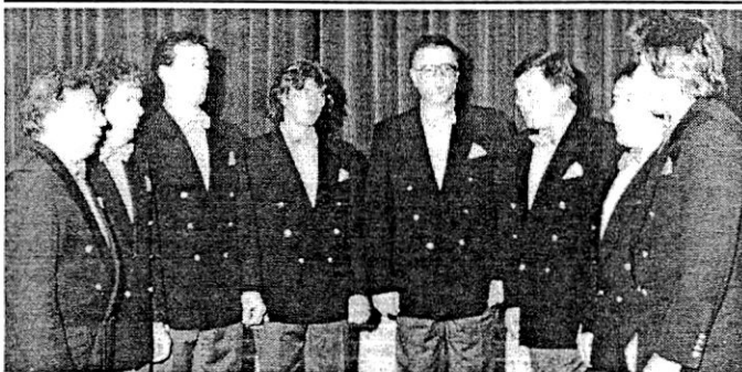
Pevci Tržaškega okteta pejejo v našem društvu

Drage rojakinje, spoštovani rojaki, pridite na ta večer, pokažite z velikim aplavzom zahvalo naši mladini. Nasvidenje na večeru plesa in "Carols by candlelight". I.B.