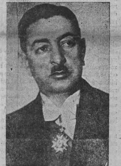
Dragiša Cvetković, predsednik jugoslovanske vlade, ki modro vodi vlado v teh kritičnih časih