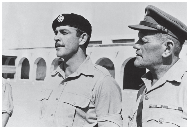
The Hill (1965)

do avtoritete enako ravnodušen kot v filmu The Hill . »Robin me vedno obsoja,« reče umirajoči kralj Richard Levjesrčni. »Prekleti kmet. Obsojati kralja!« A če bo to kdor koli počel, bo to ta trmasti in ponosni Škot. V ambiciozni in občasno osupljivi futuristični znanstvenofantastični zgodbi Zardoz (1974) Johna Boormana je bil brezsramni objekt pogleda kamere. Gol, z izjemo predpasnika in črnih škornjev, je igral barbara, vtihotapljenega med elito, ki je zgubila moč erekcije in obstaja zgolj na intelektualni ravni. Dotikajo se ga in ga božajo, fascinirajo jih njegove kosmate prsi, njegovi spomini na ubijanje in posilstvo, ki jih lahko vidijo. Boorman ni dovolj razvil te parabole petelina med kokošmi; kot da se je ustrašil intenzivno faličnih implikacij svoje zgodbe. Zato je tudi Connery v filmu deloval nekako zbegano.