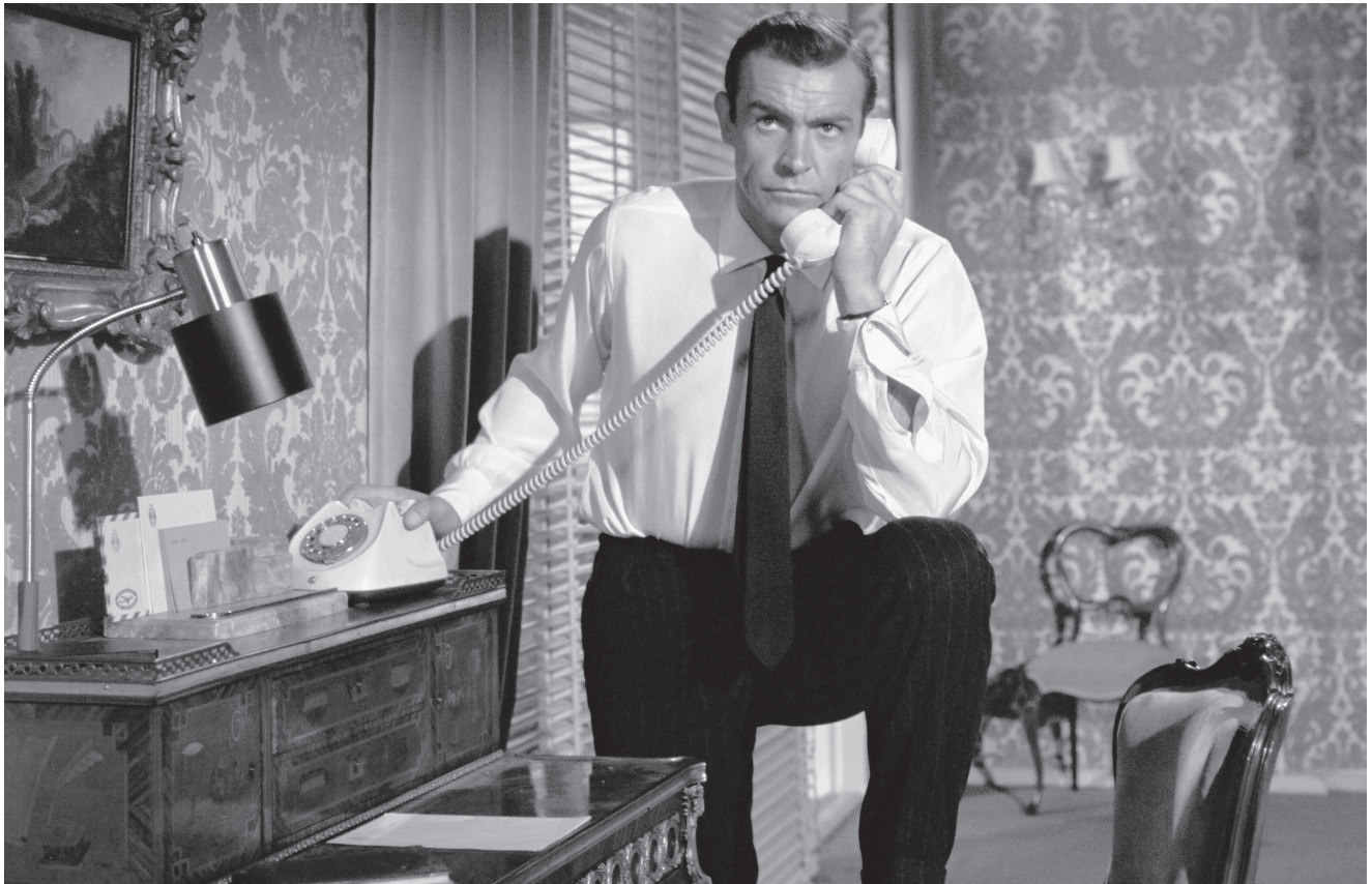
Dr. No (1962)