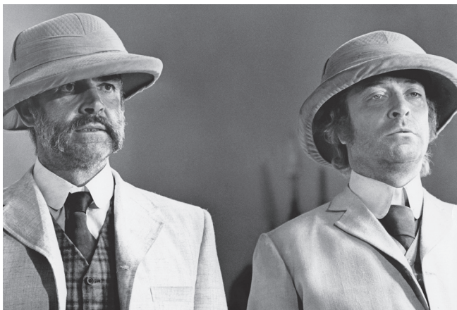
Mož, ki je želel biti kralj (1974)