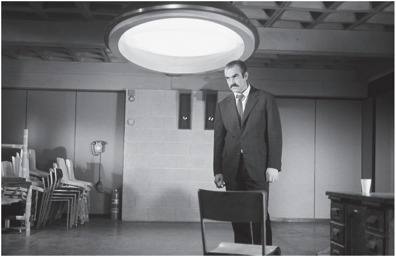
The Offence (1973)