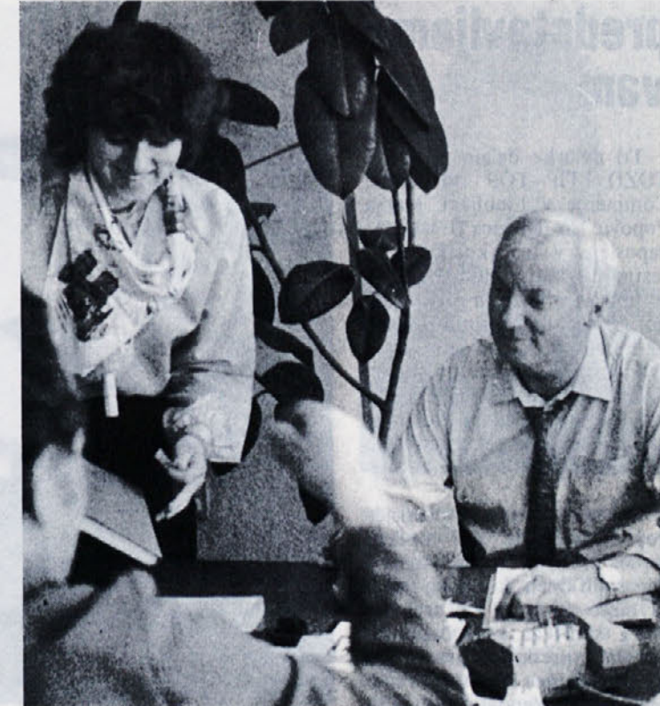
Sodelovanje med našo delovno organizacijo in Jobisom teče že peto leto. Na posnetku je tehnik tega našega Zahodno-nemškega partnerja na obisku v TOZD TIP-TOP, kjer izdelujejo oblačila za to firmo.

Za vse tri poglavja so udeleženci prejeli pismeno gradivo v predavanjih pa je bilo moč izvedeti vrsto zanimivosti v zvezi z izvajanjem zakonskih določil v praksi. Po predavanjih je bila razprava, v kateri so udeleženci postavljali številna praktična vprašanja. Prav zaradi tega je bil seminar za vse, ki se vsakodnevno srečujejo z delovnimi razmerji in disciplinskimi postopki, gradivo pa je v pomoč pri reševanju vprašanj s tega področja, posebno če vemo, da lahko zakon različno razlagamo. Zato prav gotovo udeležba na takem seminarju ni zapravljanje časa, temveč pomeni pomembno funkcionalno izobraževanje, ki naj bi ga se udeležili predvsem delavci kadrovskih služb in poslovni sekretarji.