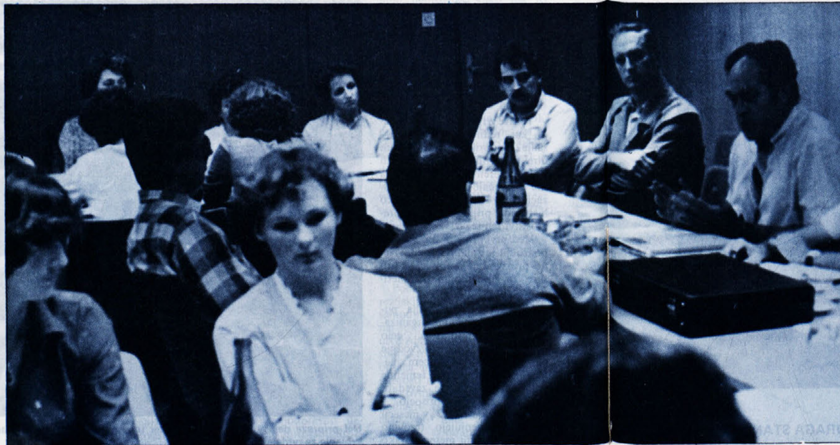
Razmišljanja in pripombe posameznih delegacij so dale prvi seji konference OO sindikatov vnaši delovni organizaciji ton in vsebino, kakršno si tudi vbodoče želimo.

Osrednja točka dnevnega reda je bila, poleg konstituiranja konference sindikatov Laboda, razprava o stališčih o dohodkovnih in delitvenih razmerjih v naši delovni organizaciji. Ob gradivu so delegacije temeljnih organizacij izrekle precej razmišljanj in pripomb. Enotno je bilo mnenje o nujnosti dograjevanja sistema delitvenih razmerij, če hočemo do leta 1983 to področje doseči in dopolniti tako, kot nam narekujejo dosedanje izkušnje in v marsičem dopolnjena zakonodaja. V razpravi je prevladovalo mnenje, da v teh novih korakih ne bodimo eksperimentalisti, pač pa se poslužujemo analiz zunanjih sistemov in pozitivnih