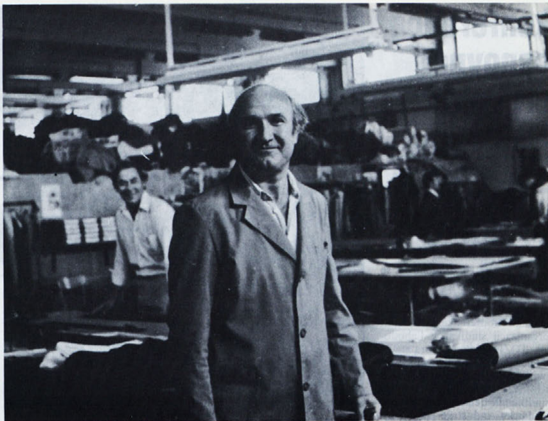
Del priprave dela v Ljubljani, kjer sicer teče modeliranje, šabloniranje, delajo vzorčne šivilje in teče krojenje za oddelek po meri.

V TOZD LIBNA organizirajo vsako leto ob jesenskem zagrebškem velesejmu tudi obisk te prireditve za brigadirje in ostale strokovne delavce. Tudi letos so si ogledali sejma. Stroške prevoza krije TOZD, ekskurzija pa je organizirana izven delovnega časa. Ker dela Libna v dveh izmenah, je bil tudi obisk sejma organiziran v dveh izmenah, da delo ne bi trpelo.