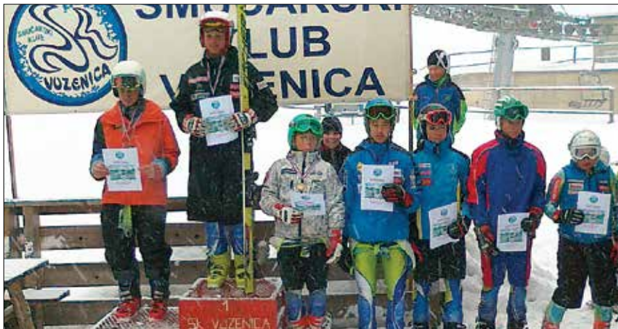
Naraločnik je dvakrat zmagal v superveleslalomu, Hriberšek (prvi z desne) je uspeh dopolnil s petim in sedmim mestom.