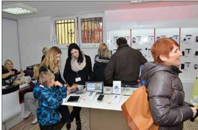
V Mozirju je svojo peto poslovalnico odprla družba Mobtel.

Prvo prodajalno so pred sedmimi leti odprli v nakupovalnem centru Interspar Šalek v Velenju. Tej so sledile druga v Tuš centru Rogaska Slatina, tretja v trgovskem centru Velejapark in četrta v centru Interspar Vič v Ljubljani. Njihovo prijazno osebje se trudi, da bi vedno našlo pravo rešitev za svoje stranke, bodisi pri sklenitvi novih naročniških razmerij, pri nakupu novega mobilnega aparata ali pa ob naku-