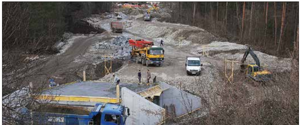
Gradnja povezovalne ceste Renek-Trnovec, nadvoz nad potokom Struga je že zgrajen

lotiranje, sedaj potekajo pripravljala dela za betonske podpornike na brežinah. Računajo, da bodo v