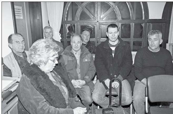
Seji sveta so prisostvovali tudi občani.