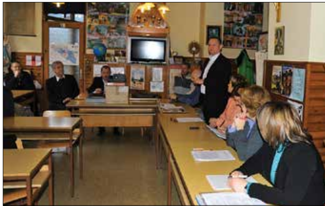
Z javne obravnave odloka, ki razglašča izdelovanja ljubenskih potic za živo mojstrovino državnega pomena.

in postopki za sprejemanje odloka, je povedal predstavnik ministrstva Gojko Zupan. Odlok sprejme vlada, pred tem pa se vsa procedura odvija na lokalni ravni. Pred sprejetjem je potrebno upoštevati pripombe in pridobiti soglasje nosilcev ohranjanja žive mojstrovine, ki sta v tem pri-