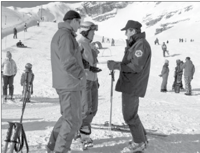
Za red in sožitje so odgovorni vsi na smučišču.

Posebno pozornost je treba poglobiti na otroke in smučarje ali deskarje novince, smuča pa se le na označenih in urejenih smučarskih progah. Kdor ne smuča, naj za hojo uporablja le rob smučišča. Zaščitna smučarska čelada je obvezna za otroke, mlajše od štiriinajst let, njena uporaba je pripo-