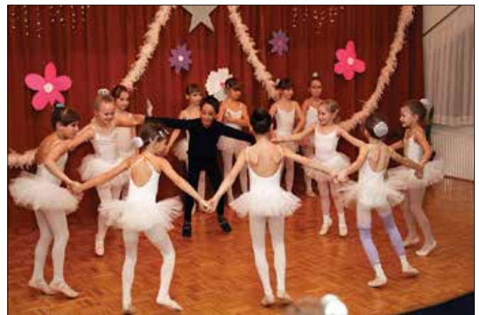
Vilinke, palčice, čudežne rožice, deklice, čarovnice in čarovnik so s svojim nežnim poplesavanjem po čudežnem gozdu občinstvo navdušili.

Očitno so si otroci želeli te dejavnosti in so pri starših dobili zaupanje ter podporo za izvedbo programa, ki je sicer nadstandardni. Ma-