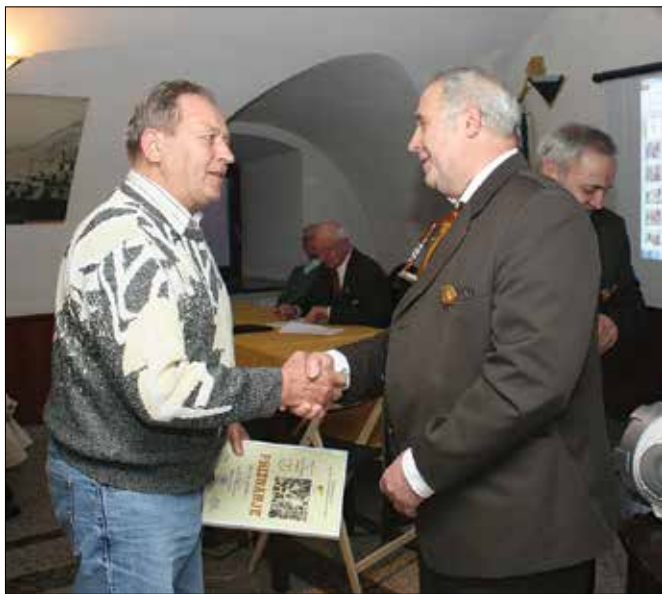
Na občnem zboru so podelili priznanja Čebelarstva zveze SAŠA za visoke življenjske jubileje.