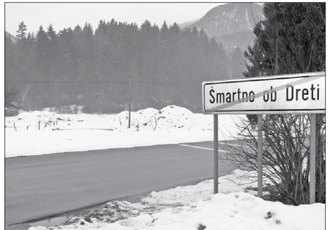
Ob koncu Šmartnega ob Dreti ob gozdu se nahaja območje Bič, kjer Občina Nazarje ureja za prodajo sedem, trenutno zasneženih parcel, namenjenih individualni gradnji.

Gornjegrajska občina nima po besedah župana Stanka Ogradija v lasti nobenega zemljišča, ki bi bilo namenjeno gradnji. So pa trenu-