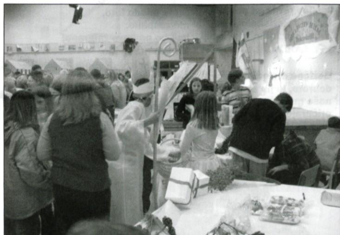
Miklavžev sejem se je začel.