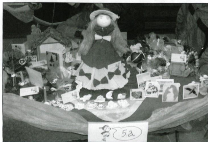
Stojnica, ki so jo pripravili učenci 5. a razreda.