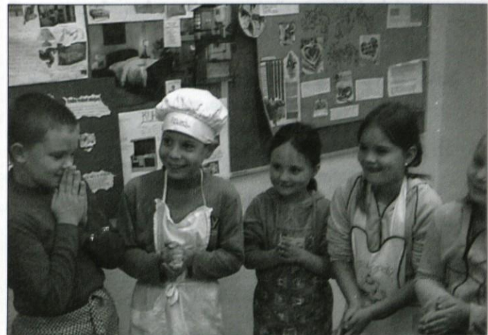
Le kdo ima "rinček"?

na učiteljica otrokom pripovedovala svoja doživetja povezana s kruhom. Kako je bilo v času njene mladosti, ko je bilo kruha vedno premalo.