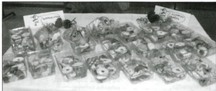
Dobrote, ki so jih spekli učenci pri gospodinjstvu in kuharskem krožku.