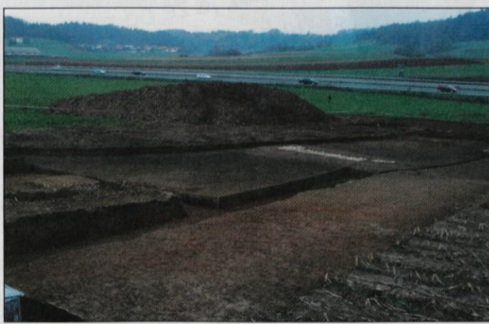
Arheološka izkopavanja na Cikavi. Pogled na severozahodni del najdišča s kamnito strukturo. Dobro vidna je temnejša plast – zapolnitev večje kotanje, ki se nadaljuje proti severu. Pogled proti severu.