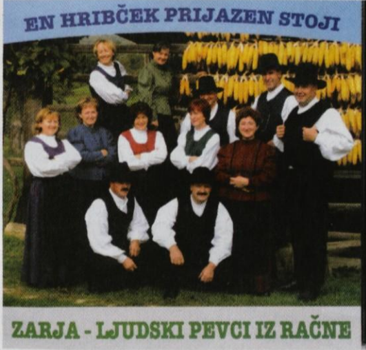
ZARJA - LJUDSKI PEVCI IZ RAČNE