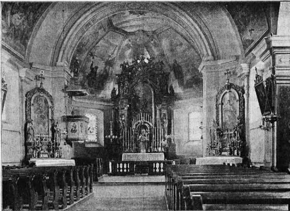
Župna cerkev na Brezovici. Notranjščina.