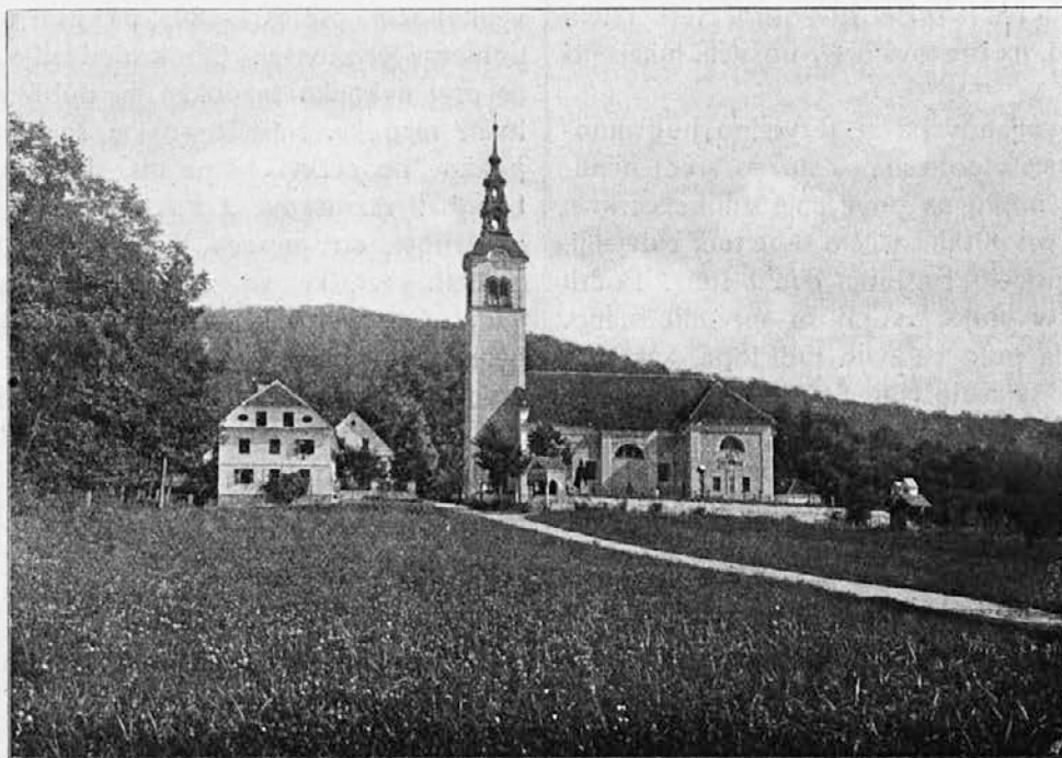
Župna cerkev na Brezovici.

Veliki oltar je posvečen sv. Antonu puščavniku. Naročili so ga leta 1862., ko so zidali nov prezbitorij, pri podobarju Mateju Tomcu v Št. Vidu. Narejen bi moral biti leta 1863., toda podobar ga zaradi svoje