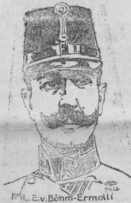
vojskovodjo v. Böhm-Ermolli za feldmaršala.