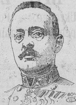
pl. Bojna je imenoval naš cesar za generalnega feldmaršala.