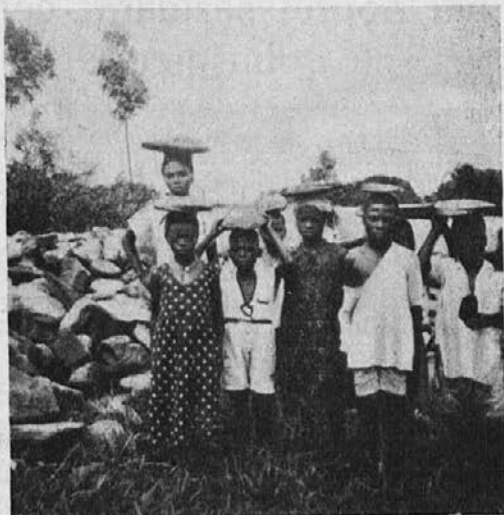
Solski otroci v Manife donajajo kamenje za novo cerkev.

spovedi 12.166, sv. obhajil 64.549. Pa sva samo dva misijonarja.