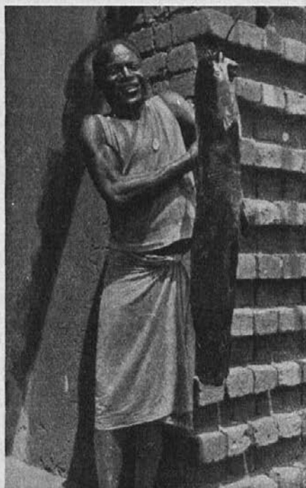
Riba iz reke Njasa.

Prijela sem jo za roko in ji pomagala v sobo. Pripravila sem ji skodelico toplega čaja in dala košček kruha. Ko se je malo ogrela, sem jo poslala domov ter ji obljubila, da ji bom prihodnjič več povedala o neskončno dobrem Bogu. Nekega dne sem ji rekla, da bom govorila s patrom misijonarjem in ga prosila, da bi jo kmalu krstil.