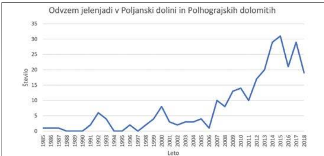
Slika 2: Odvzem jelenjadi v proučevanem območju v obdobju 1985–2018 Figure 2: Red-deer harvest in the research period 1985 – 2018

Podatke o zgradbi prostora in drugih obravnavanih okoljskih spremenljivkah smo pripravili na podlagi lastnih podatkovnih baz, vanje pa smo vključili tudi druge javno dostopne podatkovne baze (preglednica 1). Lastne podatkovne baze smo izdelali s prekrivanjem kilometrskih kvadrantov s stranicami 1 x 1 kilometer (100 ha) s kartnimi podlagami odsekov (baza podatkov o gozdovih) in uvrščanjem odsekov v ustrezne kvadrante. Izdelali smo podatkovne plasti neodvisnih spremenljivk, kjer vsak kvadrant obsega njihovo povprečno zgradbo. Javno dostopne podatke smo obdelali tako, da smo podatke različnih slojev aplicirali na raven kvadrantov. V nadaljevanju smo nato izdelali podatkovne plasti okoljskih spremenljivk, v katerih vsaka rastrska celica predstavlja povprečno zgradbo te celice in sosednjih osmih (kvadrant 3 x 3 km). Tako smo določili in v obdelavo vključili velikost prostorske enote, ki se najbolje ujema z velikostjo letoletnih individualnih (posameznih) območij aktivnosti navadne jelenjadi (Jerina, 2006, Jerina, 2010).