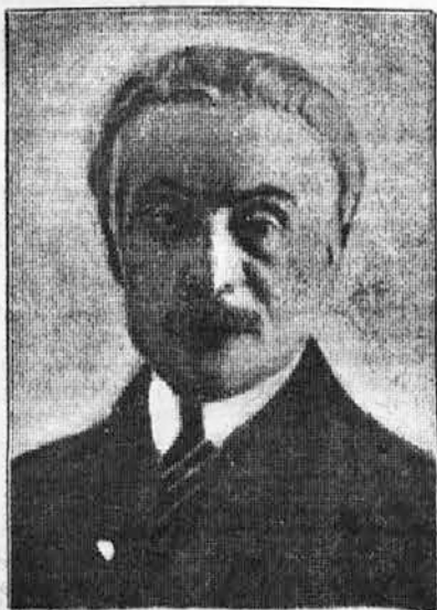
Princ Ghica, romunski zunanji minister, ki predseduje konferenci Male antante.

Uradni komuniké o poteku posvetovanj bo izdan danes - Romunski list o stališču Male antante napram nemško-avstrijski carinski uniji - Popolna soglasnost glede potrebe skupnega nastopa v vseh vprašanjih