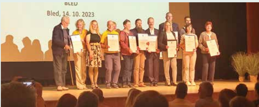
Dobitniki priznanj - posamezniki.