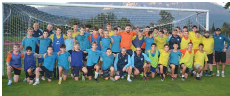
Igralci in trenerji NK Bled.

Popoldnevi na blejskem nogometnem stadionu so vsak dan zelo pestri, zadnje septembrsko sredo pa je bilo v športnem parku Bledec še posebej živahno. Pod okriljem Nogometne zveze Slovenije (NZS) in Medobčinske nogometne zveze Gorenjske Kranj (MNZG Kranj) je potekal Grassroots festival za nogometaše vseh starostnih kategorij.