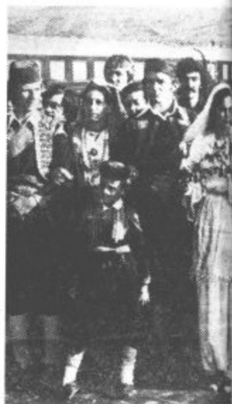
Takole so prvi vlak in Tito pričakali mladinci in mladinki Crne gore.

tega dne narodno slavje, ljudje so se zbirali, krasili postajni poslopja in svoje hiše, plesali, kola, še posebej svečano pa so Baru pričakali svoje prve goste. Dograditev proge Beograd-Bar je taših največjih in najpomembnejših in največjih akcij, ki predstavlja tudi pomemben gospodarski dosežek, saj s tem odpiramo to področje Evrope odkoder že vozijo inozemska vlaki prve goste pa tudi prvo tovare na doslej težko dostopno področje našega Jadrana.