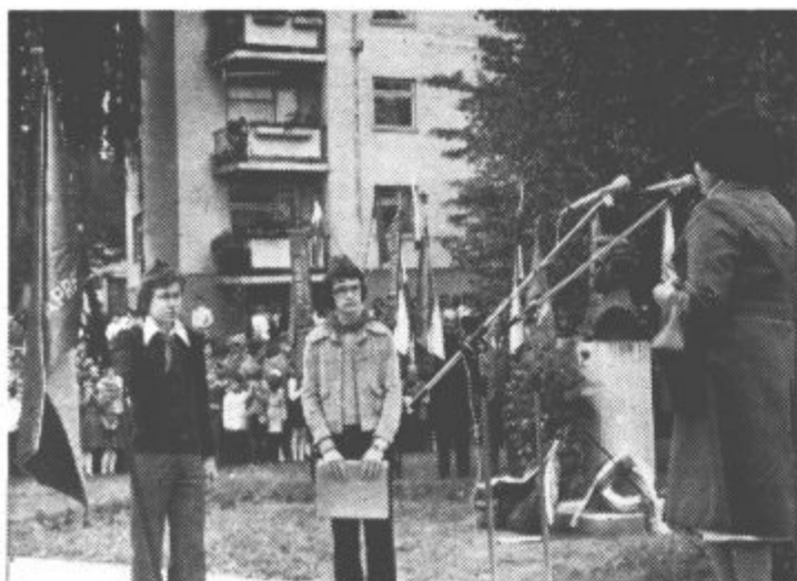
Na spominski slovesnosti so razvili tudi prapor pionirskega odreda, ki se odslej imenuje po Toledu