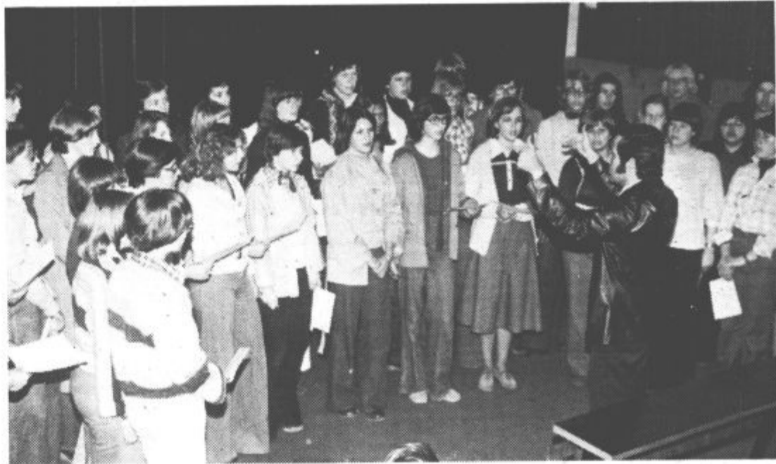
Na sprejemu v občinski skupščini Velenje

Danes zvečer ob 20. uri bodo v knjižnici v Velenju odrpli razstavo barvnih fotografij. Razstava bo odprta vsak dan od 9. do 19. ure, ob sobotah pa od 9. do 13. ure.