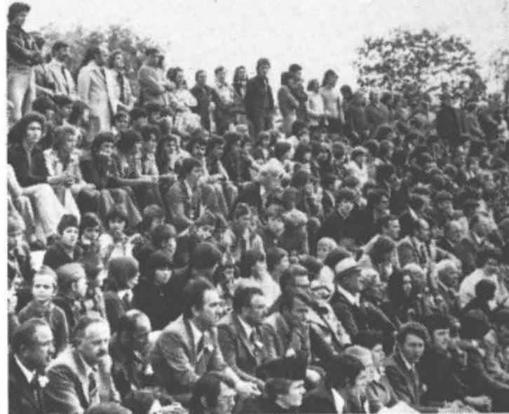
Blizu tisoč prebivalcev Velenja je v soboto popoldne nadvse toplo pozdravilo goste iz pobratene Vrnjačke Banje.

Člani delegacije Socialistične republike Srbije so si zatem ogledali proizvodnjo v več tovarnah velenjskega „Gorenja“, v Rdeči dvorani pa so si ogledali razstavo „Gorenje 76“.