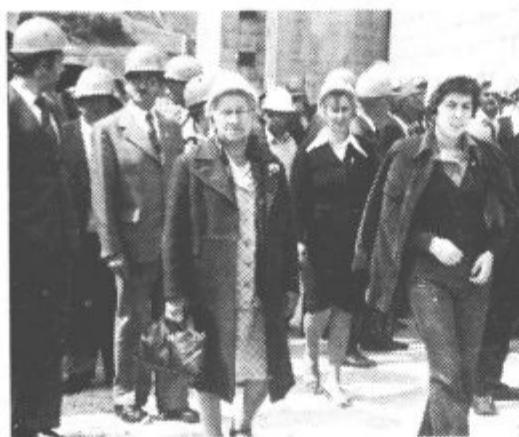
Gostje na ogledu v termoelektrarni