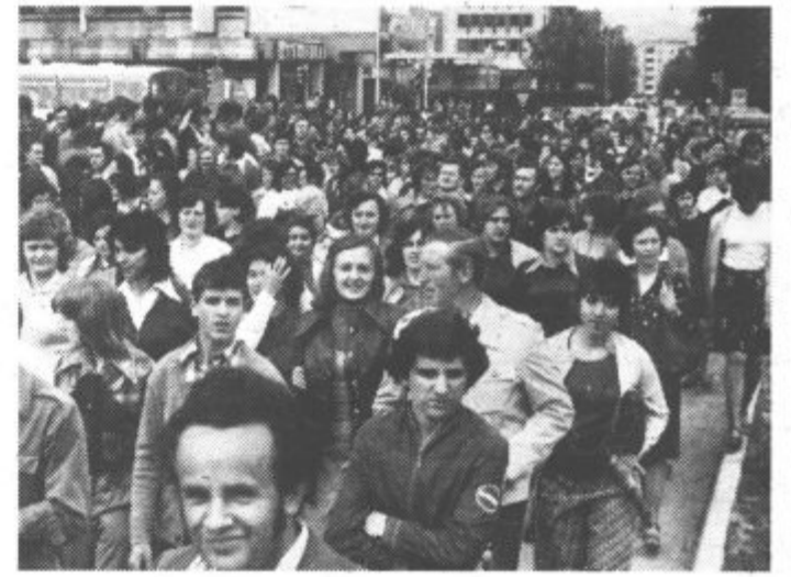
Gorenjčani pred Rdečo dvorano