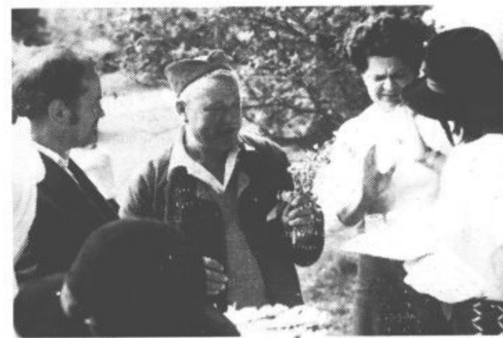
Potem ko so gostje stopili iz avtobusa, so jih obkrožili fantje in dekleta v narodnih nošah, jim izročili šopke ter ponudili kruh in medico po starem slovanskem običaju.

• Pogovori predstavnikov občin Vrnjačka Banja in Velenje