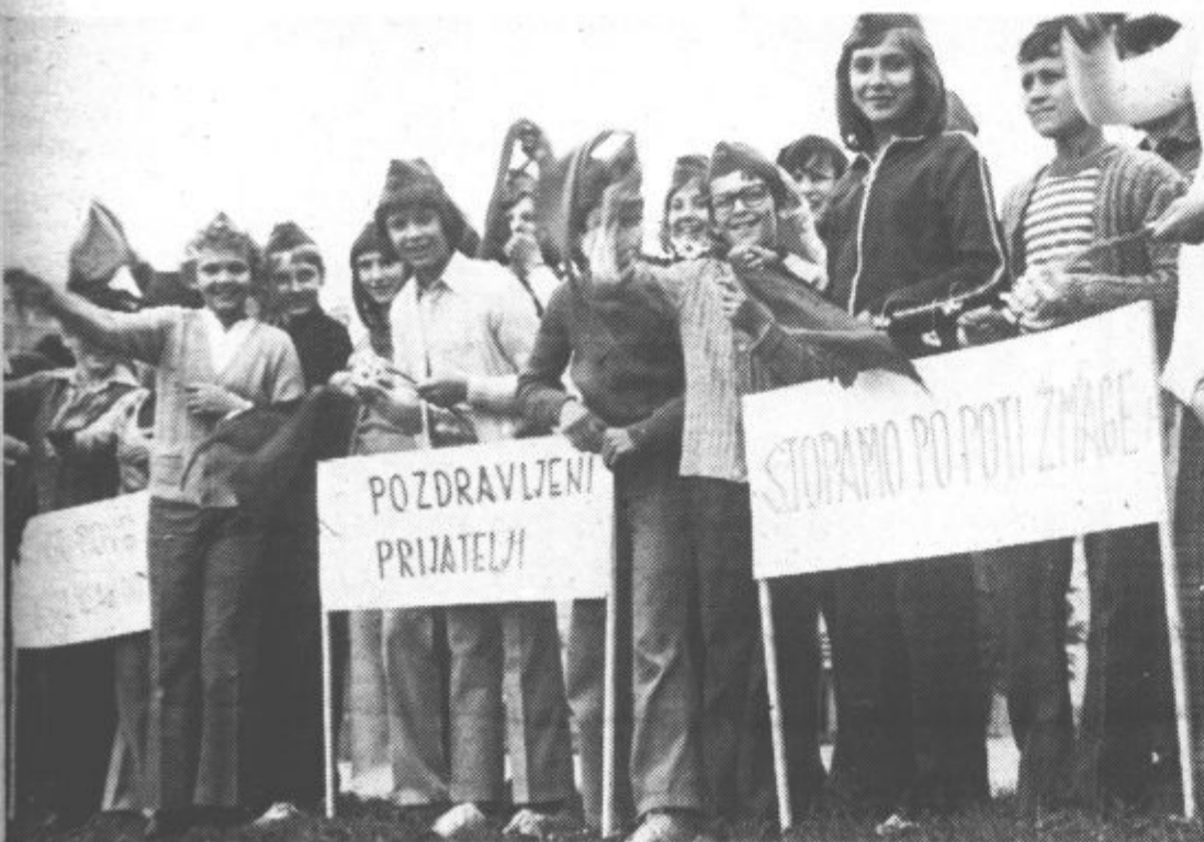
Velenjski pionirji so zaželeli dobrodošlico nekdanjim gostiteljem iz Srbije