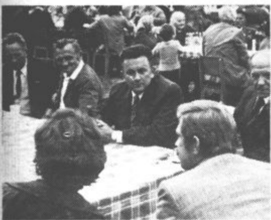
V Smartnem ob Paki so že v nedeljo stekli prvi pogovori med delegacijama krajevne skupnosti Novo selo ter Smartnega.