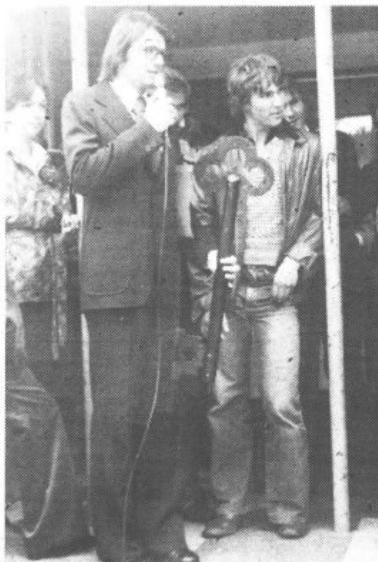
Vloga prodajalca in kupca se je zamenjala

Svet ZK krajevne skupnosti Velenje - Stara vas bo organiziral in usmerjal aktivnost članov Zveze komunistov, ki živijo v krajevni skupnosti Velenje - Stara vas, ne glede na to, kje so povezani v osnovnih organizacijah. Člani Zveze komunistov, ki živijo na območju krajevne skupnosti Velenje - Stara vas, bodo morali sodelovati v aktivnostih, ki jih bo organiziral in izvajal svet ZK krajevne skupnosti Velenje - Stara vas.