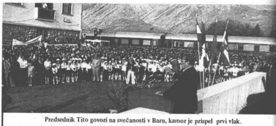
Predsednik Tito govori na svečanosti v Baru, kamor je prispel prvi vlak.

Akcija, ki so jo začeli in o kateri so sanjali že pred minulo vojno, se je tokrat uresničila. V izredno kratkem obdobju so v dolžini 476 km, na izredno težkem terenu, položili tračnice in s tem odprli pot vlakom, ki bodo letno prevozili 6 do 7 milijonov ton blaga in več kot 19 milijonov potnikov. To je proga, kjer je kar 254 predorov v skupni dolžini 114,5 km in kjer bo lahko dnevno vozilo do 60 vlakov. Proga so zgradili z ljudskim posojilom v višini 900 milijonov dinarjev in po sedanjih izračunih bo proga v 8 do 15 letih vrnila vloženi denar. Proga teče skozi področja, kjer ni bilo doslej nobenega prometa, kjer se dvigajo mogočni sebrti kot oporniki mostov, katerih višine so često najvišje v dosednji gradnji mostov v Evropi. V teh predelih so še ljudje, ki niso nikoli videli vlaka, ki se