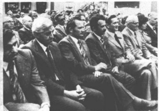
Gostje — udeleženci svečane seje Skupščine občine Slovenj Gradec.