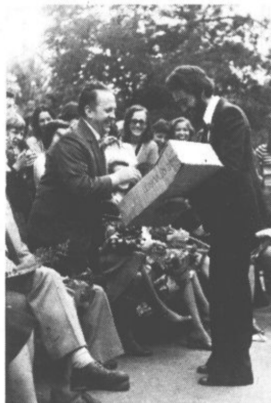
Kot dokaz, da jih imajo še vedno radi so jim poklonili praktična darila.