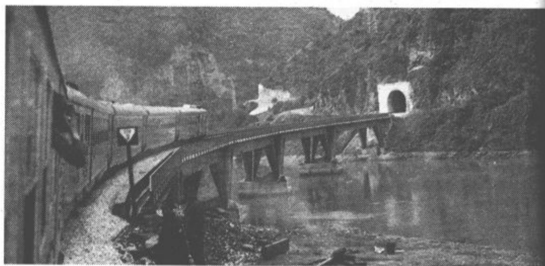
Vlak bo pravkar izginil v enega izmed 254 predorov.