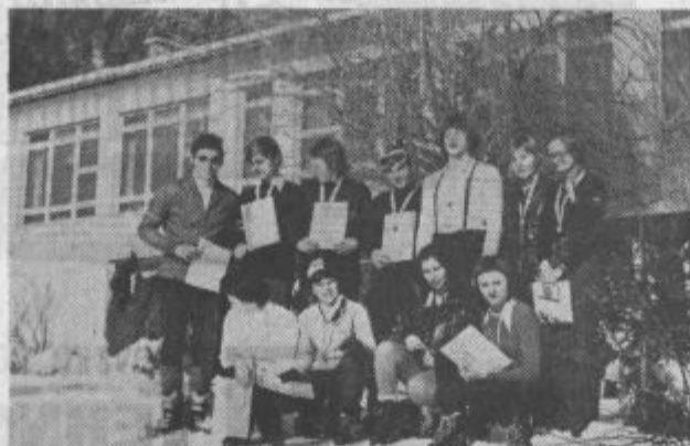
Na obeh fotografijah so najboljši uvrščeni smučarji z občinskega tekmovanja v Belih vodah