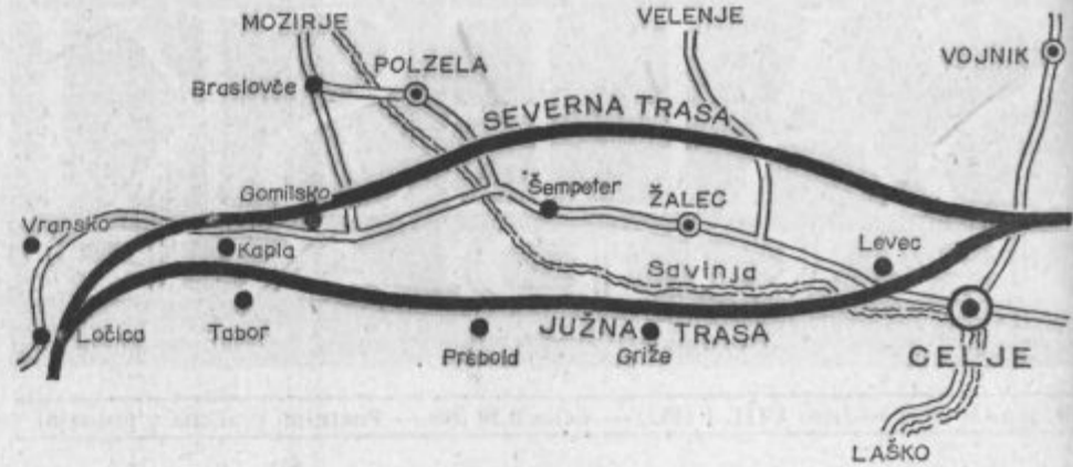
Skica severne in južne trase hitre ceste