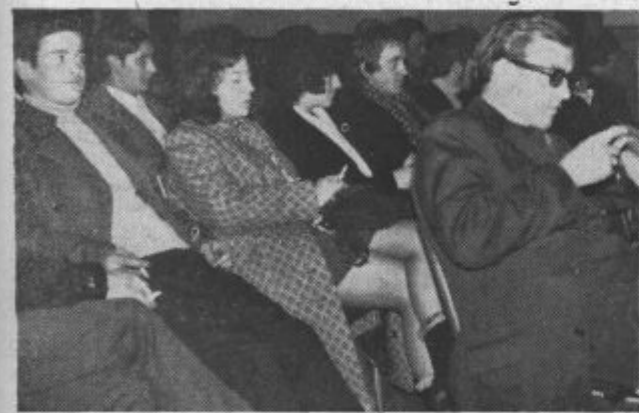
Zaključek tekmovanja je bil v prosvetnem domu Pesje