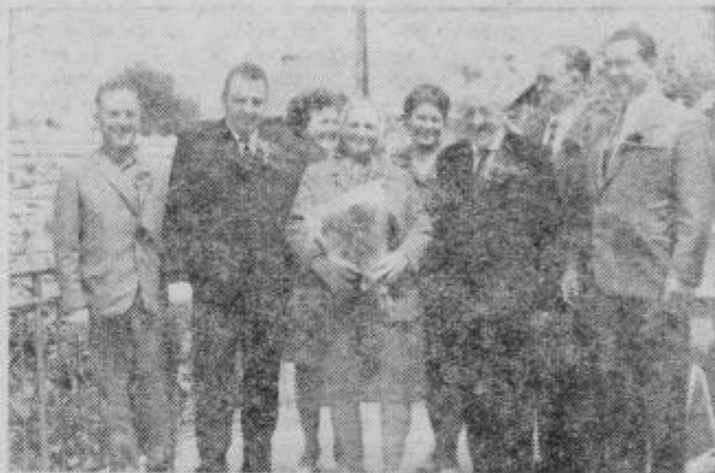
Zlatoporočnica s svojimi gosti na vrtu hotela Poetovlja

Ob sobotnem klepetu z našima jubilaroma in njihovimi svojci sem zabeležil še marsikaj zanimivega. Žal vam vsega ne morem opisati. Lepih in bolečih spominov je preveč, da bi jih lahko zajel v tem zapisu, ki je v bistvu izsek 50 let mirne pa zopet nemirne in begajoče družinske sreče in domačnosti, ki so je bili deležni na njuni