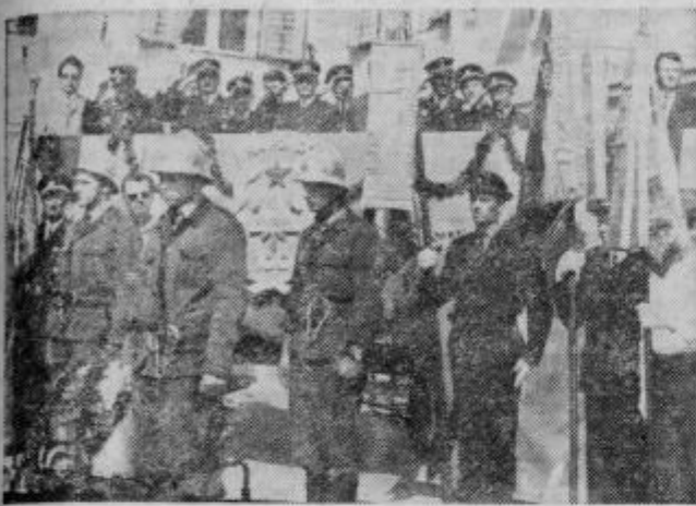
Z zborovanja gasilcev na Trgu svobode

Z dobro voljo, prostovoljnimi delom ter s finančno pomočjo so Črešnjevčani le uredili svoj kulturni dom. Urejen je izredno lepo in so lahko na svoje delo ponosni. Sicer pa bodo lahko sedaj še z večjo voljo kot doslej oživljali svojo kulturno tradicijo.