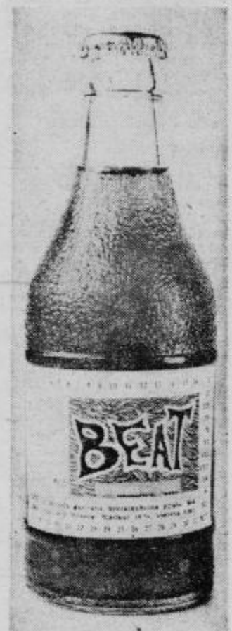
Nova brezalkoholna pijača Beat odžeja in osvežuje PETOVIA PTUJ

še 120.000 dinarjev kmetom borcem za reševanje njihovih problemov. Ta sredstva pa so dobljena iz republiškega prispevka in iz sredstev skupščine občine, ki jih je dala v ta namen. -b