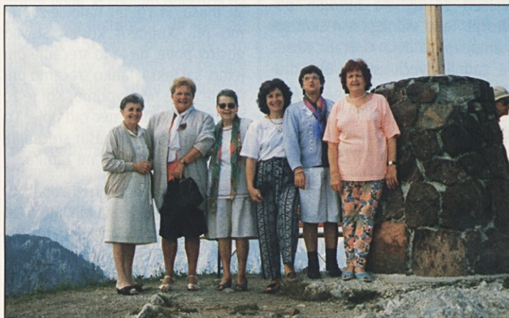
Člani slovenske misije iz Merlebacha smo lani poromali na Višarje.