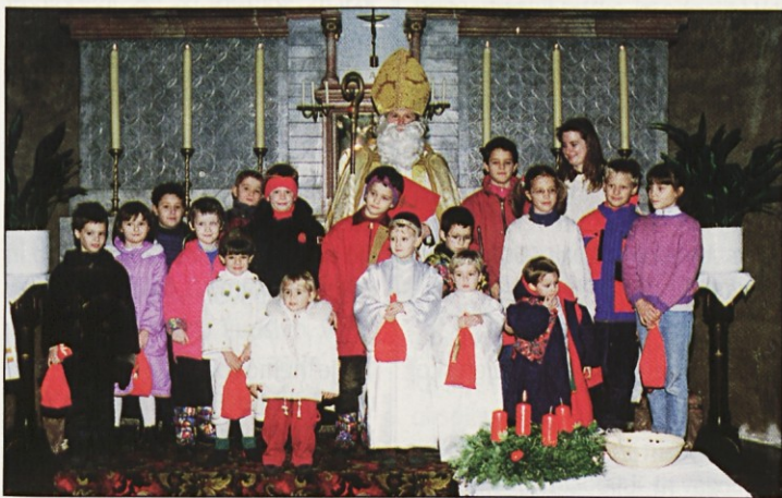
Tretjega decembra nas je v Slovenskem pastoralnem centru na Dunaju obiskal sveti Miklavž.

Žalostno jutro, kakor vsako drugo, se je zbudilo na poseben način. V