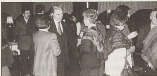
Urad za Slovence po svetu je v hotelu Lev priredil slavnostni sprejem za učiteljice in učitelje slovenskega jezika z južne poloble.

Od 20. pa do 31. januarja pa so učiteljice in učitelji z južne poloble v organizaciji Urada Republike Slovenije za Slovence v zamejstvu in po svetu popotovali po Sloveniji, Beneški Sloveniji in Koroški ter spoznavali zgodovinsko in kulturno dediščino slovenskih krajev ter se srečevali z domačini v mestih in kra-