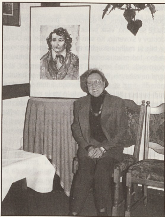
(Mainz) Gospa Marija Sulzbach ob Prešernovi sliki, ki jo je sama narisala

njegovi brundajoči pesmi zbor žag nekje v dolini in šum rahlega vetra in ploskali so mu listi na bližnji trepetliki.