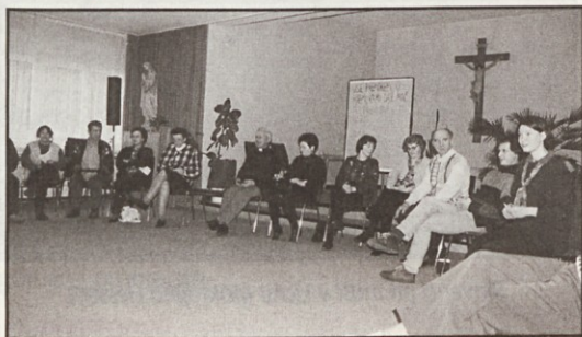
(Stuttgart) Na seminarju z geslom "Moč pozitivnega mišljenja" smo se zares obogatili z novimi spoznanji.