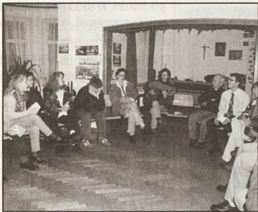
(Stuttgart) 21. 1. 1996 smo se mladi še posebej srečali z gostoma iz Slovenije.

“On daje svoj veter pihati. Da, tak veter, da ruje stara stoletna drevesa. Kako mogočen mora biti on! Kako silen in strašen v svojem srdcu. Saj je vseokrog kakor sodni dan! Korenine te stare smreke kar ječijo in v nogah čutim, kako se dviga zemlja v navalu vetra, ki meša vse v strašen vrtinec: dež točo, suhe veje, cele šope odtrganih vej. Vse to nekam divja, se podi skozi gozd. Nekje hrzajo konji, legija konj, žvižgajo vrage na prste, vrešče vražje čarovnice pod temnim pregrinjalom motnega neba. Vmes se pode divja dekleta od drevesa do drevesa tako naglo, da vidim samo njihov mokri pajčolan in slišim samo njihov divji hihot.