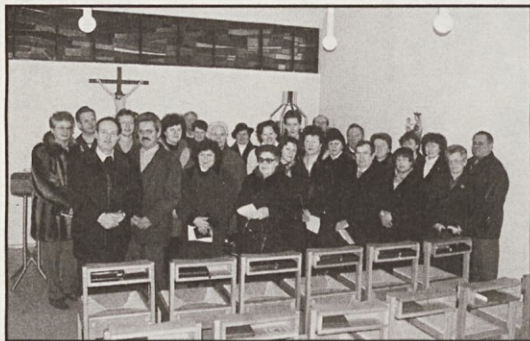
(Stuttgart) V Schorndorfu imamo slovensko bogoslužje v kapeli sester Dominikank misijonark v hiši sv. Martina.

"Prenašam ga, Pejpa, kakor mačka svoje mlade. Kakor da sem njegova babica. Otročji postajam. To