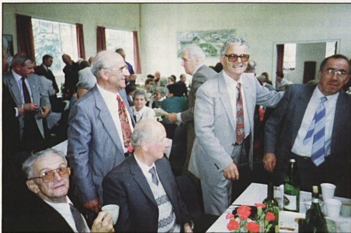
Posnetek s Slovenskega dneva v Rochdalu

Poudariti moram, da je bil takrat naš pastoralni svet edina slovenska ustanova v V. Britaniji, katere člani so bili demokratično izvoljeni. Zato je bil svet kasneje tudi