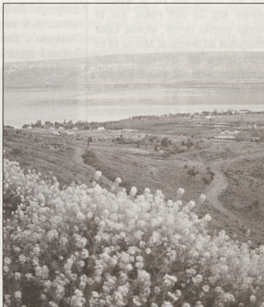
Rodovito polje ob Genezareškem jezeru

Glede tega, kdaj so predniki Izraelcev prišli v Egipt, se zdi zelo verjetna hipoteza, da so šli Jožef in njegovi bratje tja, ko so Hiksi z vojsko zavzeli Egipt in tam prevzeli oblast. To je bilo okrog leta 1700 pred Kristusom. To pojasnjuje, zakaj je bil faraon tako naklonjen tem prišlekom iz Azije; sam je bil namreč prišlek. Jožefa je imel tako rad, da ga je postavil na