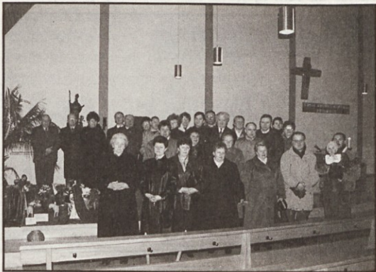
(Stuttgart) Udeleženci slovenske maše v Aalnu

"Čakaj. Najprej bomo večerjali. Belka je že, saj je lepo okrogla. On je zanjo poskrbel. Za naju pa ni, Pejp. Midva si morava večerjo preskrbeti sama. In niti lonca nimava. Ko se je streha zrušila, je šlo vse v črepinje. Tudi lonec z mastjo. Mast je zgorela, koruzna moka tudi, poslednja skorja kruha prav tako. Vrč mi je razbila toča. Suknja in odeja in slama, na kateri sva spala, so zdaj pepel. Da, Pejp, zdaj sva tako brez