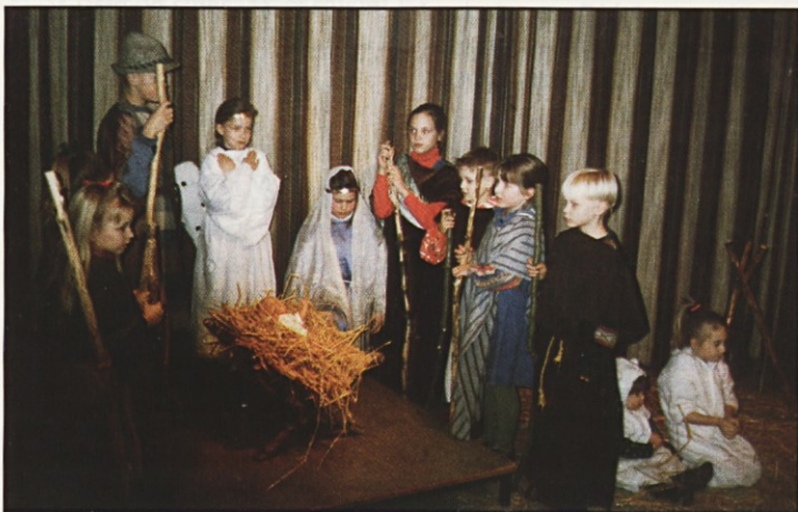
(Nizozemska) "Škrjančki" so čudovito zapeli ob jasliah.

ni ali duhovni, ki ste mi ga namenili ali pa mi ga še namenjate doma in v tujini. Kajti tudi s temi darovi se delajo dobra dela še naprej. Po njem darujete vi sami. V zahvalo za darove pa se vas vaš duhovnik, sorodnik in prijatelj z veseljem spominja v molitvah in pri sv. mašah, ki jih daruje za sorodnike in dobrotnike. Naj Gospod, ki vidi vaša dobra dela na skrivnem, bogato povrne že tukaj na zemlji z zdravjem in blagoslovom! Hvala vsem družinam, ki svoje dušne pastirje sprejmete pod streho, ko po dolgih poteh pridejo utrujeni med vas. Hvala za vsak "košček kruha, vode" in vse dobrote, ki jih vselej radi pripravite, kadar vas obišče vaš dušni pastir. Hvala za posteljo, ki je ob poznih večernih urah in po stotine prevoženih kilometrih še kako dobrodošla. Hvala za vsak dar, tudi denar, ki pomaga zmanjšati stroške življenja vašim dušnim pastirjem, še več, ki od njih poroma kdaj tudi v še potrebnejše roke. Ne doma ne na Švedskem vaši duhovniki nimajo prave