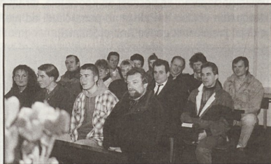
Slovenci pri maši v Lichu (pokrajina Hessen)

V novomeški Krki Novoterm stalno izboljšujejo kakovost in zdravstveno ter ekološko neoporečnost izdelkov, razvoj pa prilagajajo novim dosežkom tehnike v svetu. Zdaj so trgu ponudili nov izolacijski material Novoterm K 40 plus, ki je zdravstveno povsem neoporečen, biološko razpadljiv in ne draži dihal.