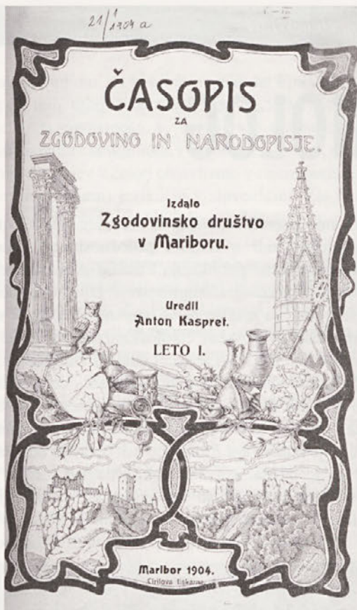
Prva številka Časopisa za zgodovino in narodopisje iz leta 1904.

Datum prejema prispevka v uredništvo: 13.7. 2004