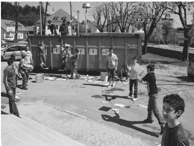
Odpadnega papirja pa ničkoliko.