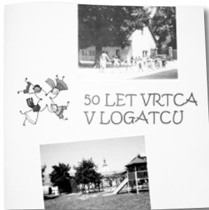
Publikacija ob 50-letnici Vrtca.

Prikupna slovesnost je počastila pomembno obletnico vztrajnih prizadevanj za krepitev otroškega varstva na Logaškem