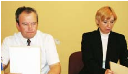
Hudega dela nista imela ne župan ne direktorica občinske uprave.

Iz predlagane dnevnega reda je bila umaknjena ena točka, in sicer čistopis odloka o imenovanju ulic v naselju Logatec, ki naj bi se sprejel po skrajšanem postopku. Temeljni odlok je bil že šestnajskrat dopolnjen, zato je povsem nepregleden, čistopis pa naj bi mu zagotovil normalno preglednost. A se je temu od svetnikov zdelo besedilo preobsežno (79 poimenovanj!) da bi ga lahko sprejemali po skrajšanem postopku, onemu, da odlok podaljšuje Titovo ulico in je zato potreben vsaj redni postopek sprejemanja. Pojasnilo, da gre za čistopis že sprejetih poimenovanj in da je za sprejem čistopisov predpisan skrajšani postopek, svetnikov ni prepričal. Čutiti je bilo, da nekateri svetniki želijo spremembo posameznih poimenovanj. Soglasja ni bilo mogoče doseči, pa je predlagatelj točko umaknil iz predloga dnevnega reda, kar je zatem svet večinsko sprejel.