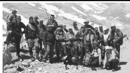
Pod gorovjem Bele gore.

Konec aprila sem s planinci Podpeč-Preserja in z Balkaniko obiskala Kreto, edinstveno po raznolikosti naravnih lepot in bogastvu ostankov preteklosti, zaradi česar velja za pravega »predstavnika« lepot Mediterana.