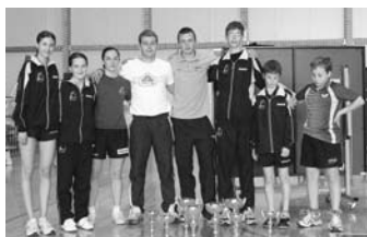
Kadeti kar zmagujejo.