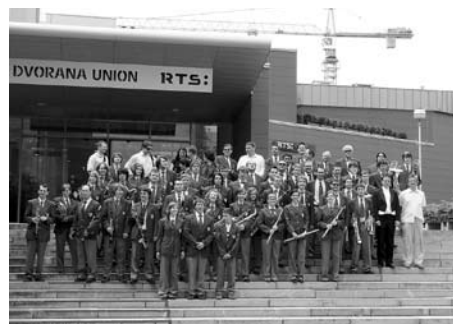
Naši zlati fantje.