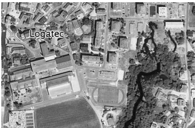
Do kod vse segajo rovi požiralnika Jačka.