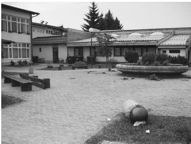
Srhljivo klavrna podoba polskega dvorišča po Majskem koncertu 23. maja v grajskem parku.

Dogodki so si sledili v treh pomladnih mesecih. Marec – z grdimi grafiti nekdo porišo fasado Podružnične osnovne šole Hotedršica ter avtobusne postaje v Hotedršici. April – na velikonočno soboto sredi dne ob šolskem igrišču zagori otroško igralo, vredno okrog 1500 evrov. Maj – v noči, ko se odvíja Majski koncert v Grajskem parku, nekdo popolnoma uniči cvetlično zasaditev pred Osnovno šolo Tabor, prevrne klopi in smetnjake ter za seboj pusti pravo razdejanje. Ogorčenju vaščanov, zaposlenih in večine učencev ni konca. Posvetujemo se in se odločimo, da posledic vandalizma ne odstranimo takoj. Naj ljudje vidijo, kaj se nam dogaja. Nam vsem. Obvestimo policijo in prisluhnemo pripovedim vaščanov in se odločimo za vztrajanje. Obnovili bomo fasado ter avtobusne postaje v Hotedršici, kupili bomo novo igralo in znova zasadili cvetlice v naš »vodnjak«. Ne bo nam težko, ker smo vztrajni, ker znamo in hočemo, ker nam znajo in hočejo priskočiti na pomoč tudi prebivalci. Vendar pa ostajajo razmišljanja in vprašanja brez odgovorov