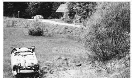
Nemarno zapuščene razbitine.