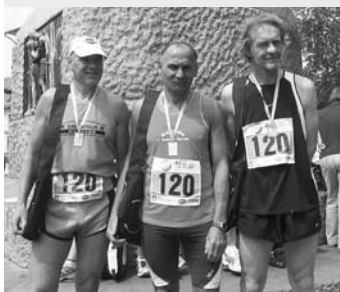
Zmagovalna trojka GRC nad 50 let.

V počastitev osvoboditve Ljubljane in dneva Evrope so bile 9. maja v Ljubljani poleg drugih prireditev tudi tekmovalni teki