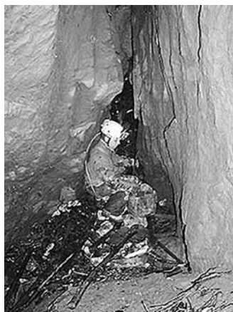
Naplavine pred vstopom v nove dele požiralnika.

Vsake toliko časa pa le koga jama privabi. Običajno jo obiščemo, ko v društvo pridejo novi člani in bi si jama radi vsaj enkrat ogledali. Tako smo se 13. novembra 1999 podali v požiralnik Jačka 3. Kljub temu da je pred požiralnikom postavljena rešetka, in da je na vходу v jama še ena, voda v podzemlje odnese veliko plavja. Raziskovanje smo začeli tako, da smo odkopali rov, ki je bil zasut z naplavinami (plastična embalaža in siporex). Za ožino smo prišli do manjše stopnje nato pa v krajši vodoraven rov. Nadaljevanje zaradi obilice naplavin ni bilo možno. Odločili smo se, da bomo pred ožino, ki smo jo odkopali postavili dodatno mrežo, ki bo zadrževala naplavine in da se bomo v jama še vrnili.