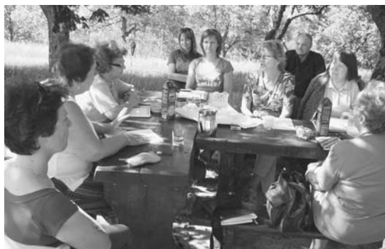
Literarna delavnica pod Gašparevčevim orehom.

Nepozaben pa je bil literarni večer, ki so ga pripravili člani Literarnega društva