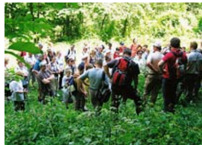
Pravcata množica pohodnikov.

Od tam do Mlinov, kjer izvira Unica (pod zemljo se združita Pivka in Rak) ni bilo več daleč. Da je bilo mlinov precej, smo videli na starih fotografijah, da je v njej dovolj rib, smo lahko sklepali po navdušenih ribičih. Koliko vas bo stal ulov, pa vprašajte tam, kjer izdajajo dovolilnice. Še nekaj korakov čez polje, še pogled z mostu v čisto reko, in prišli smo do cerk-