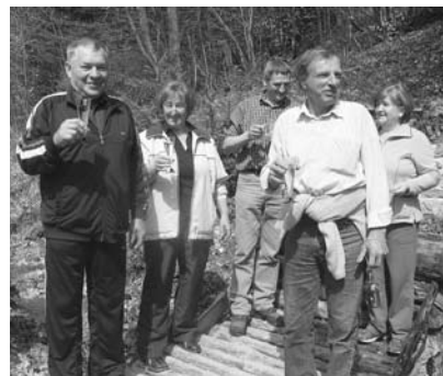
Joj, kako je dobra!