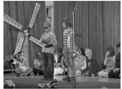
Evropa na odru.

Tretarji so se podali na Finsko, deželo tišočerih jezer. Naučili so se njihovo pesem in jo spremljali z instrumenti. Četrtrajem je bila najbolj všeč Nemčija, od koder izhaja vsem ljubiteljem bencinskih hlapov znani Michael Schumacher. Celotna njihova predstavitev je bila njemu posvečena. Petarji so predstavili kar dve državi: deževno Veliko Britanijo in Romunijo s slovitim krvoločnim grofom Drakulo. Šestošolci so predstavili Grčijo s plesom sirtaki. Tudi sedmarji so predstavili dve državi: Portugalsko v znamenju nogometa in Francijo z Eiffelovim stolpom, ki so ga sestavili vrli učenci. Skupina osmošolcev je predstavila Dansko, deželo Andersenovih pravljic in lego kock, druga skupina se je podala po Jakobovi romarski poti v Španijo in na sceni prikazali celo bikoborbo. Devetošolci so z eno skupino predstavili našo sosedo Avstrijo z Mozartom in Straussom; zaplesali so kar najbolj znani dunajski valček Na lepi modri Donavi. Druga skupina devetarjev pa se je lotila naše Slovenije. Prikazane so bile raznolikosti slovenskih pokrajin od morja do Triglava, od panonske nižine pa do Gorjancev.