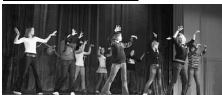
Gledališka pomlad.

V majski številki Logaških novic pomotoma ni bila objavljena fotografija k članku Pisana gledališka pomlad na str. 22. Za pomoto se opravičujemo avtorici Bojani Levinger in fotografiji objavljamo ob tej priložnosti.