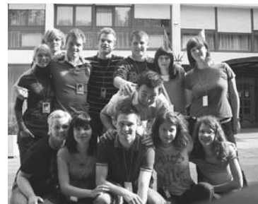
Med najboljšimi mladinskimi gledališčniki.