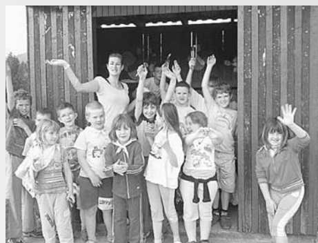
Poslikali so postajališče v Hotedršici.

Ravničani so nad hotenjskimi postajališči tako navdušeni, da so dali pobudo še za poslikavo avtobusne postaje pod Ravnikom. KS Hotedršica bo finančno podprla tudi to dejanje. Učenci POŠ Hotedršica pa s svojimi učiteljicami že načrtujejo mo-