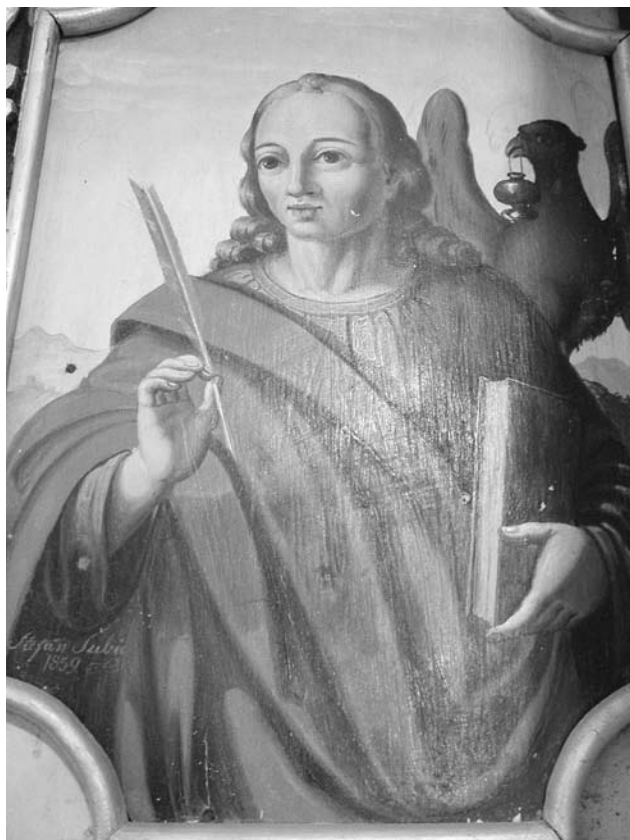
Evangelist Janez s Šubičeve prižnice