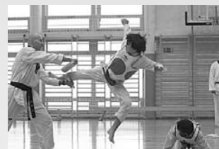
Stranski nožni udarec v skoku (Nejc v zraku)

Taekwondo pomeni v osnovnem pomenu samoobrambo, namenjeno neoboroženemu boju. Je moderna tradicionalna borilna veščina, v kateri sodeluje celotno telo in sistem. Za borbo se uporabljajo različni gibi telesnih udov človekovega telesa v različnih položajih (stoje, na tleh, v skoku). Najpogostejši gibi so: udarci z rokami (pest, dlan, prsti, komolec, ramena) in udarci z nogami (stopalo, goleni, koleno).