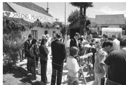
Ja, nevesta ne pojde kar tako!

Običaj, ko so fantje pred nevestino hišo postavili mlaje in napis za srečo mladoporočencema in pred poroko pred nevestinim domom postavili »šrango«, kjer je moral ženin odkupiti nevesto od sosedovih fantov, se že kar pozablja. Ta običaj srečamo le še ponekod po vaseh, v mestih, kot je Logatec, pa je to res še prava redkost, saj promet in urbanizacija kraja take običaje vse bolj onemogočata.