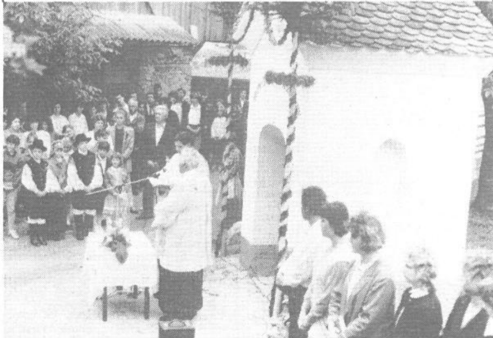
Slovesnost pred starejšo kapelico