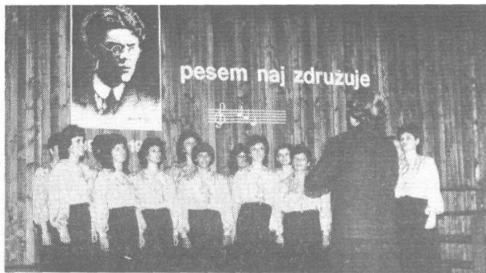
Ženski pevski zbor KUD »Marij Kogoj« s Turjaka