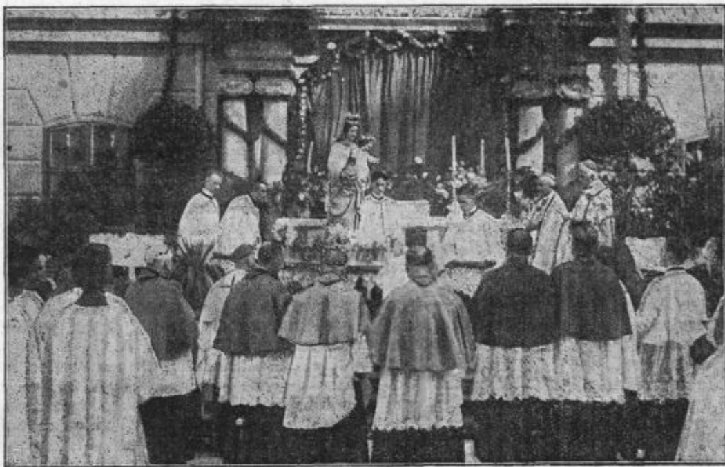
Kronani kip Marijin dvignejo za procesijo.

dalo število listov skrčiti in več listov v enega združiti. Enako bo tudi razgovor glede koledarjev, katerih je tudi toliko, da drug drugemu hodijo na pot. — Glede koledarja za Marijine družbe je neka družba odgovorila prav modro takole: »Mislimo, da bi ga prav z veseljem sprejeli, zlasti dekleta. Vendar smo pa navsezadnje mogli priznati, da če se eden rodi, bosta morala umreti dva. Dosedaj si je Marijina družba štela v svojo dolžnost, razpečavati Misijonski in Klaverjev koledar. Če dobimo svojega, bomo morali ta dva opustiti. To so naše misli. Storite pa, kakor se Vam boljše zdi!«