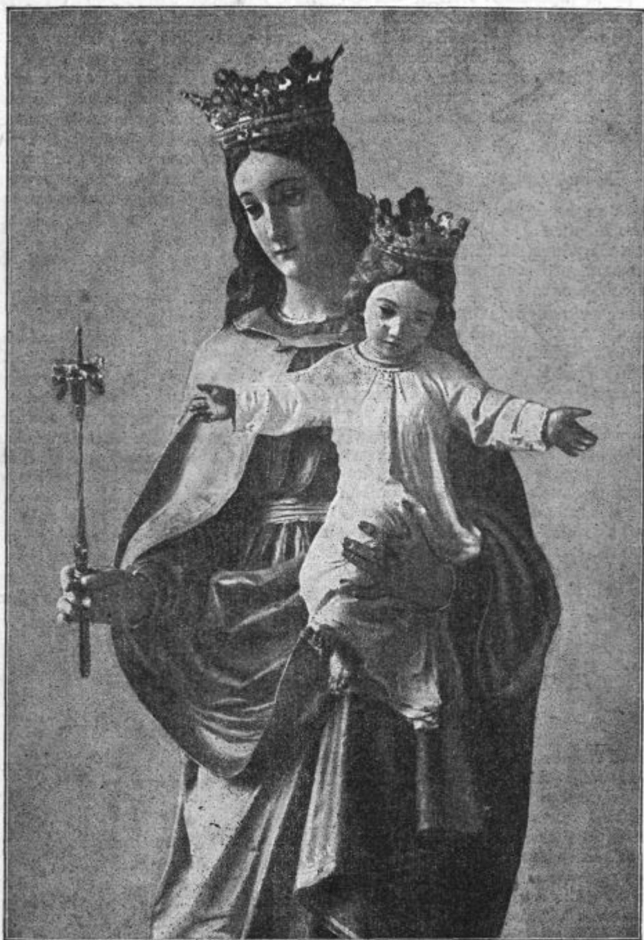
Kip Marije Pomočnice na Rakovniku, kronan in prenešen v slovesni procesiji marijanskega kongresa iz mesta v novo- posvečeno svetišče.