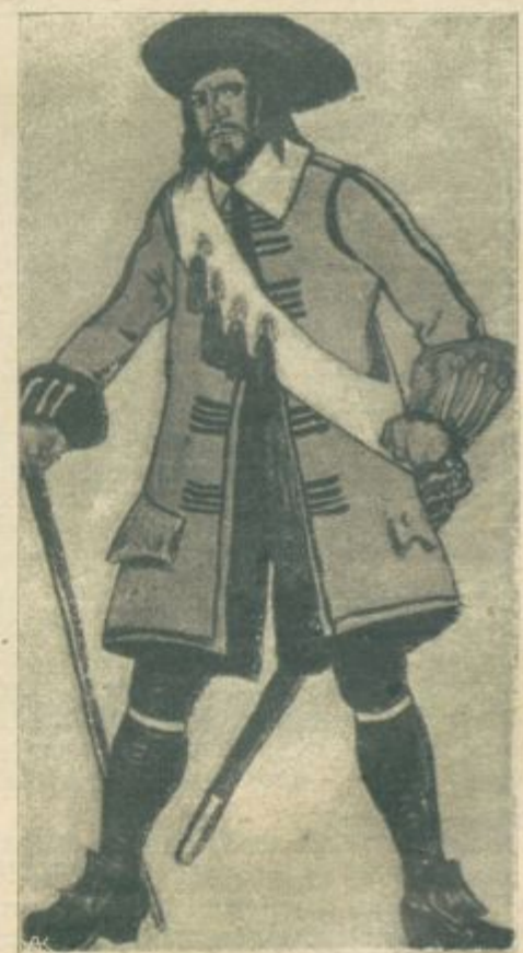
Tip vojskovodje izza kmetskih bojev.

»Hvaljen bodi!« je odgovoril kovač. »Kako pa je kaj na polju?«