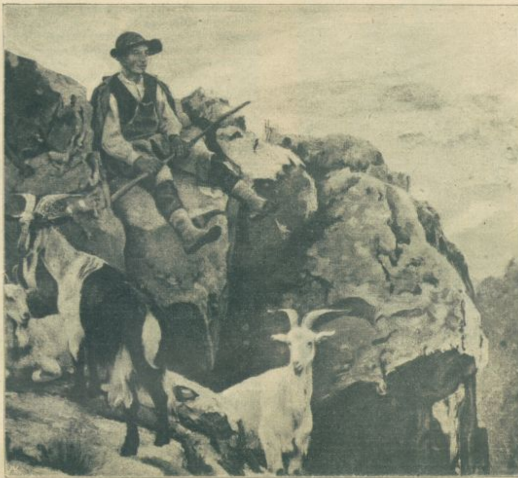
Italijanski kozji pastir, iz okolice Rima. (Po risbi Leudorffa.)

»Poglejte, otroci,« je rekel ter zapisal na tablo besedo: dom; »poglejte, kakšna modra reč je pisanje. Ta tri znamenja so tako majhna, zavzemajo tako malo prostora, a vendar pomenijo — dom. Če le pogledaš na to besedo, takoj vidiš pred očmi celo poslopje: vrata, okna, vežo, sobe, peč, klopi, slike na stenah, skratka: vidiš dom z vsem, kar je v njem.«