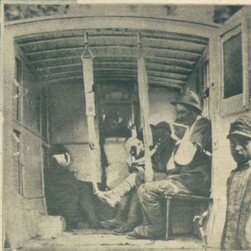
Italijanski ranjenci iz bojev pri Plaveh v ambulančnih [avtomobilnih vozovih.

»Glejte, otroci,« je rekel. »To črko si je lahko zapomniti, na videz je taka, kakor bi kdo plesal kozačko, pravi pa se