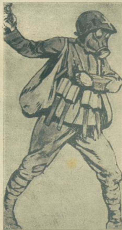
Todobni grenadir z ročnimi granatami in z masko proti strupenim plinom.

Najbrže si bo vlada tako pomagala, da bo sestavila številnejše uradniško ministertvo, v katerem bodo po svojih ministrih zastopane razne narodnosti. Želeti bi bilo v blagor države in narodov, da se čimprej uravnajo nasprotstva in da pride