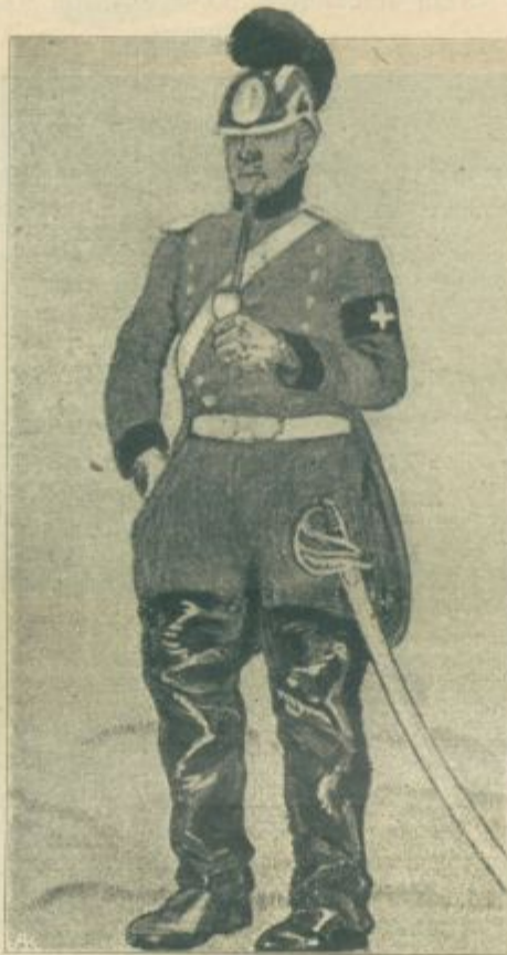
Dobrovoljni dragonec izza francosko-nemške vojne leta 1870—71.

vice, kakor jih ima že od leta 1887. šest milijonov Madjarov. Jugoslovani pa zahtevajo jugoslovansko državno skupino pod avstrijskim cesarjem.