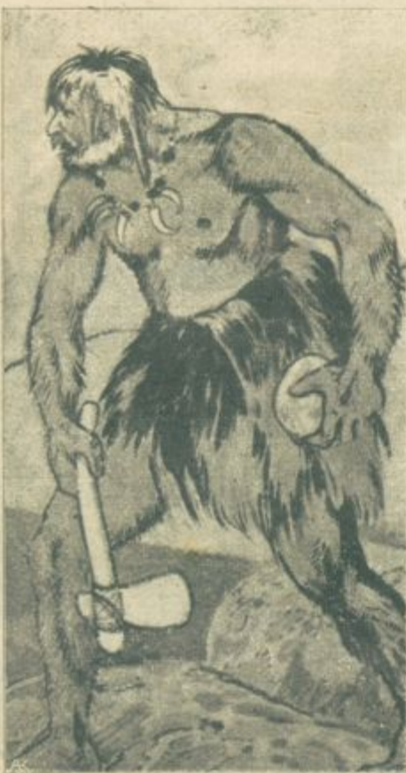
Pračlovek, ki nam grozi s kamenitim betom.

»Hvaljen bodi!« je zaklical kovaču s prağa.