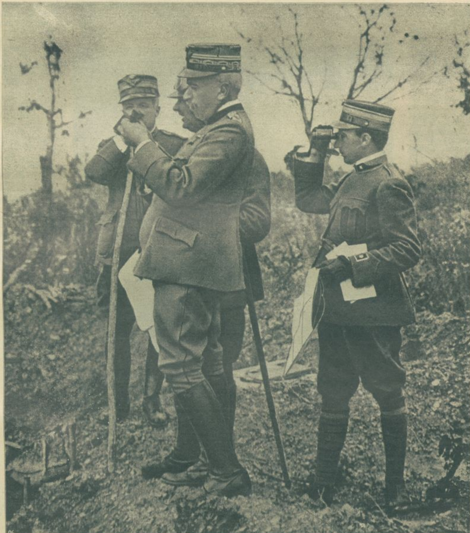
Cadorna opazuje s častniki svojega generalnega štaba razvoj bojev vzhodno Gorice.