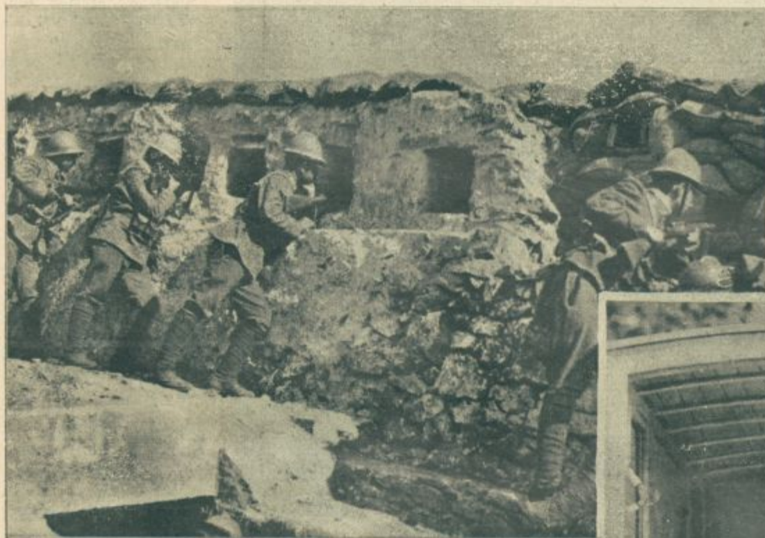
Izza desete soške bitke. — Zidani laški strelski jarbi.

Učitelj je narisal tretjo in četrto črko, otroci so jo nazvali z enim glasom in pričela se je izkušnja.