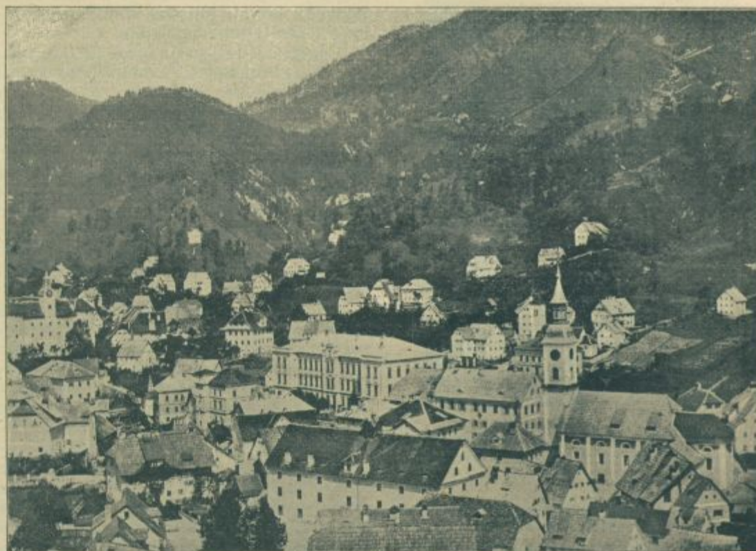
Zgornji del Idrije. 10 malih in velikih laških letal je zopet obiskalo Idrijo ter vrglo po predmestju, na električno žico itd. več bomb, ki so — kakor poročajo — povzročile le nekaj strahu.