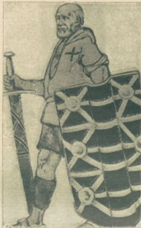
Stari Švicar z mečem in ščitom, uplenjenim v bitki pri Morgartenu leta 1315.

najstege leta, a za gospodarstvo ni kazal najmanjšega veselja. Rezal je svoje količke in napravljajal iz njih občudovanja vredne podobe. Šele ko se mu je pokazil pipec in mu mati ni dala denarja za novega, je pričel hoditi na delo. Temu je ponoči na