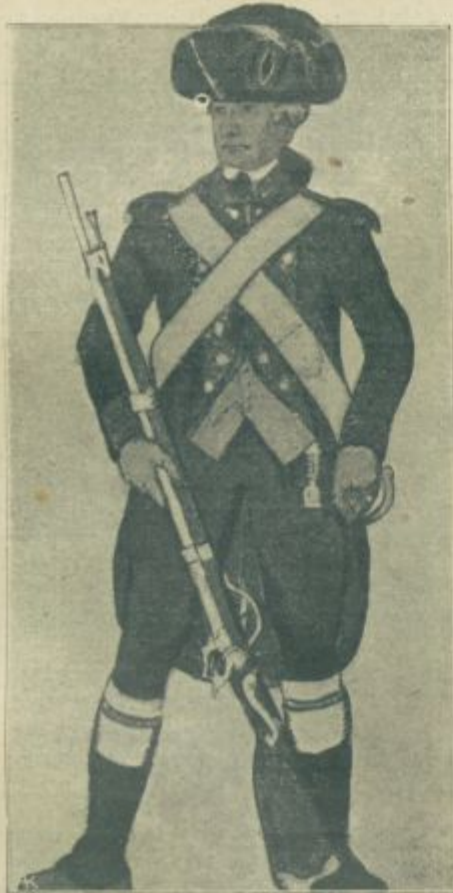
Rdeči švicar Napoleonovega polka iz vojske proti Rusiji leta 1812.

Pa tudi v naši državni polovici so stvari med posameznimi narodi tako zapletene in zamotane, da po sedanji ustavi