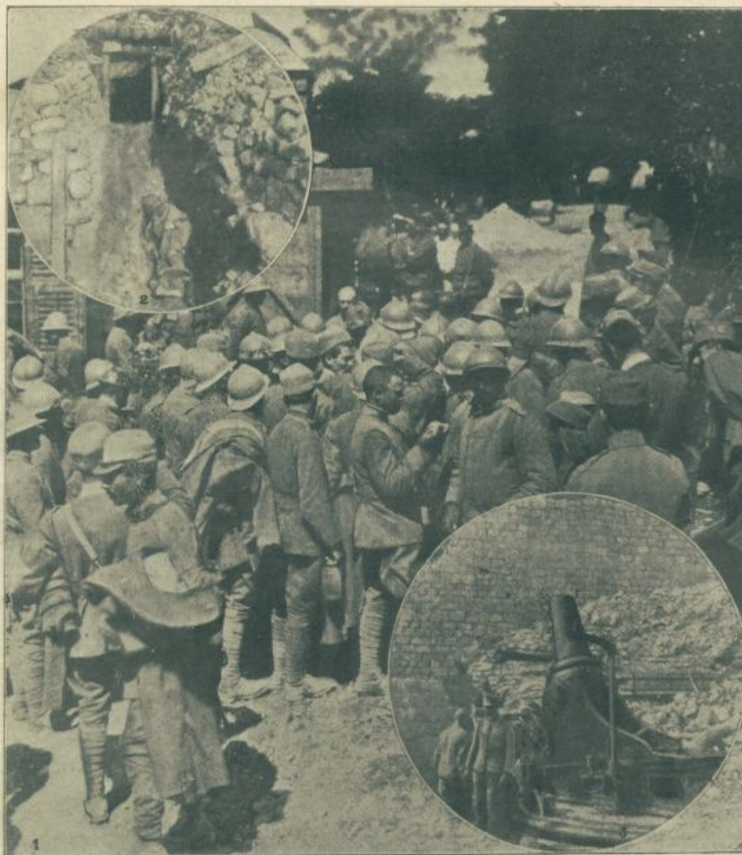
Slike s soške fronte: 1. Zaslišavanje laških ujetnikov. — 2. Osvojeni strelski jarek z mrtvimi italijanskimi vojaki. — 3. Zaplenjeni 28 centimetrski možnar.

»Dodajte pozdrav, pišite, naj pišejo gotovo.« — »Sem zapisal.«