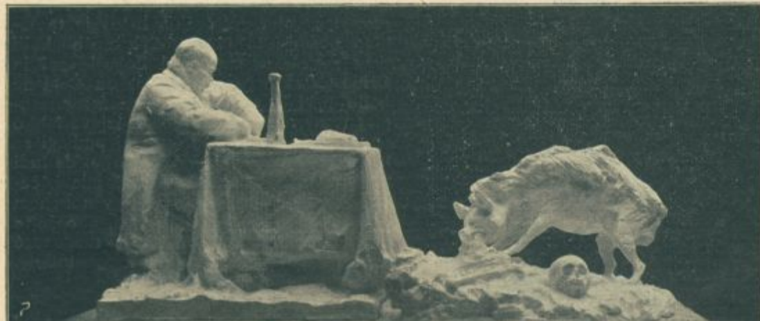
Knez Trubeckoj: »Ki se z mrhovino rede...« (kip).