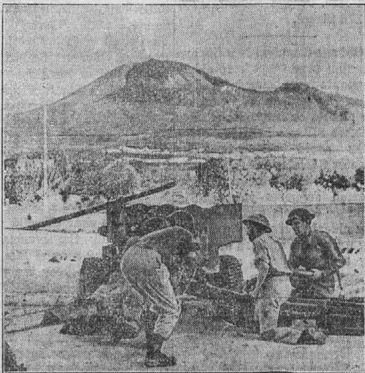
IN THE SHADOW OF MT. VESUVIUS, anti-tank gunners of a British regiment have set up their weapon at a vital crossroads. General Mark Clark's victorious Fifth Army is composed of about equal numbers of Yanks and Tommies who are together driving the Nazis northward through Italy.