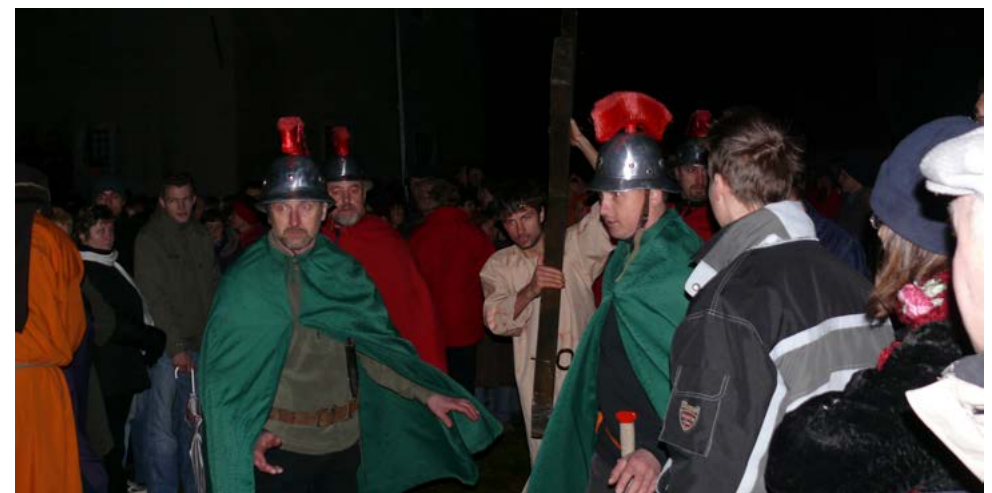
Jezusov križev pot med gledalci. Foto: Erik Vider, 2008

V letu 2008 je vlogo režiserja prevzel takratni ribniški kaplan, Jure Ferlež, ki je nastopil tudi v vlogi igralca. Gledališkemu delu pasijona smo spremenili zaklju-