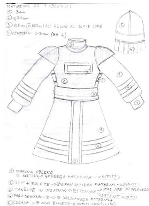
Skica novega kostuma tempeljskega vojaka.