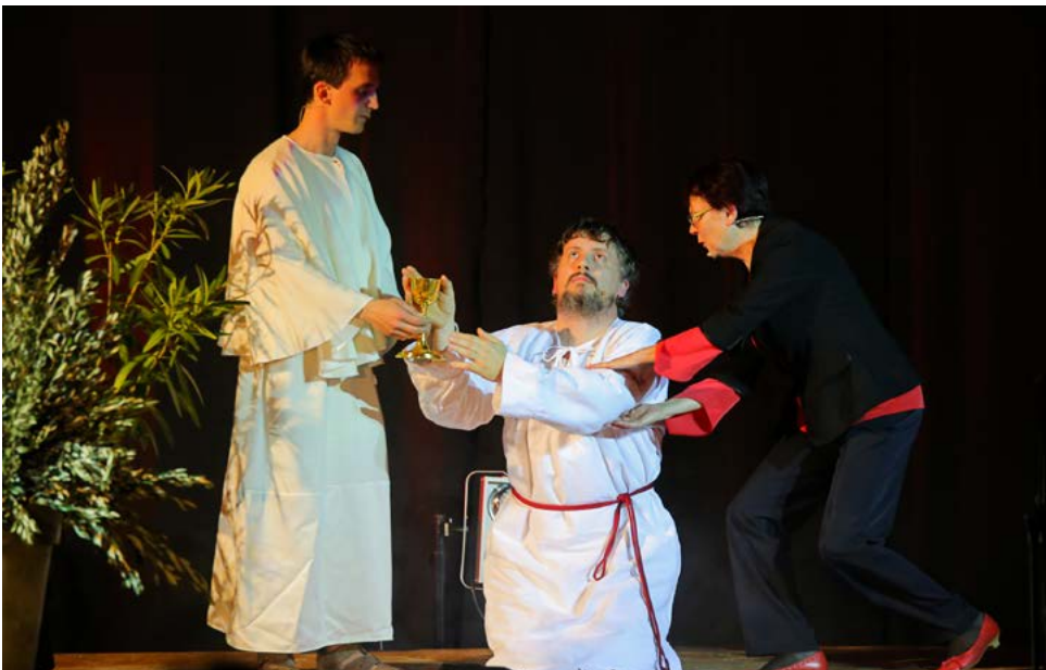
Jezus med angelom in hudičem v vrtu Getsemani. Foto: Matjaž Maležič, 2016

Poznaš me kot nihče, vajen gledat' si mi v srce, očisti, prosim, ga, s krvjo operi in odkupi me.