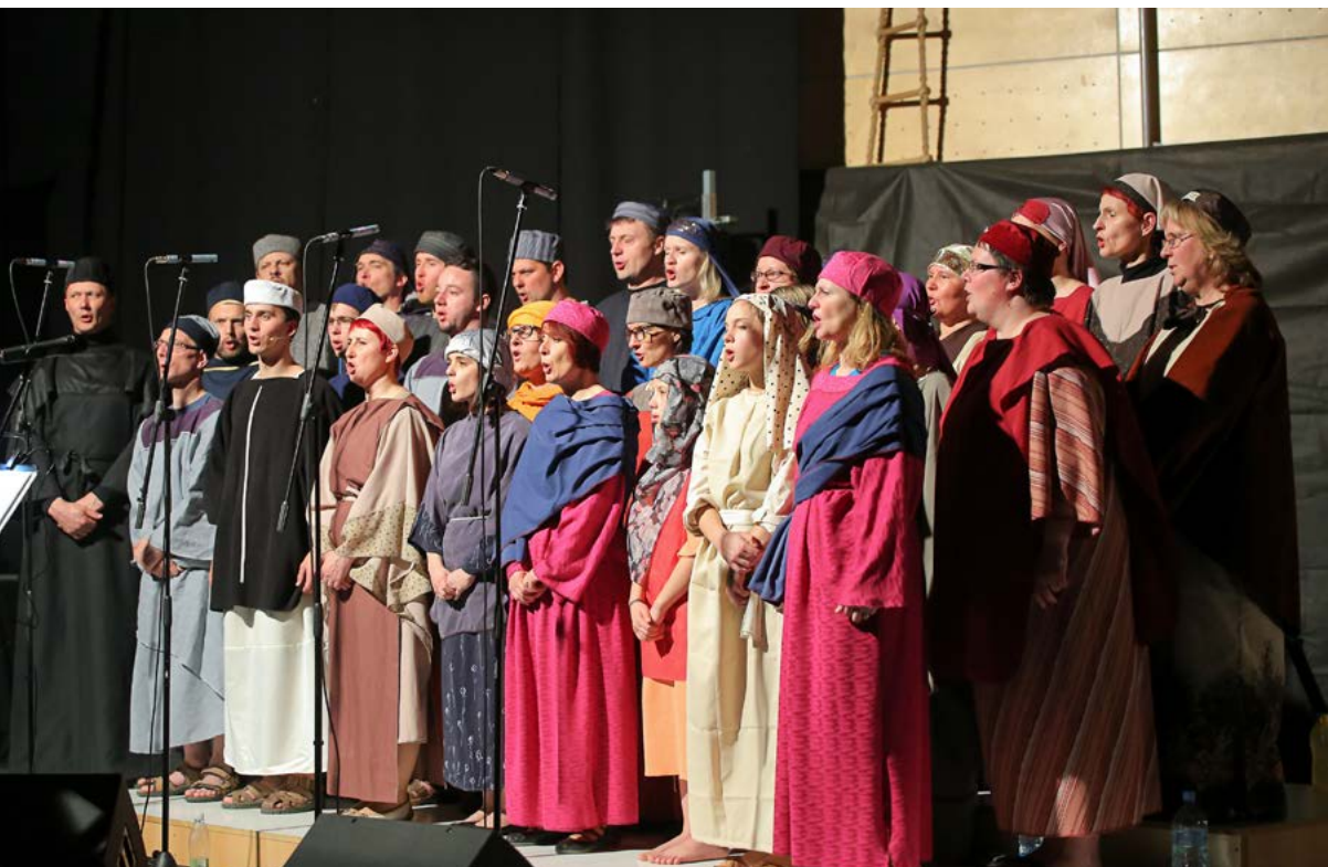
Zaključni prizor zadnje uprizoritve ribniškega pasijona leta 2016.