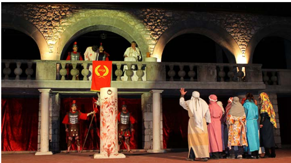
Ambient ribniškega gradu ter nove obleke in oprema rimskih vojakov.