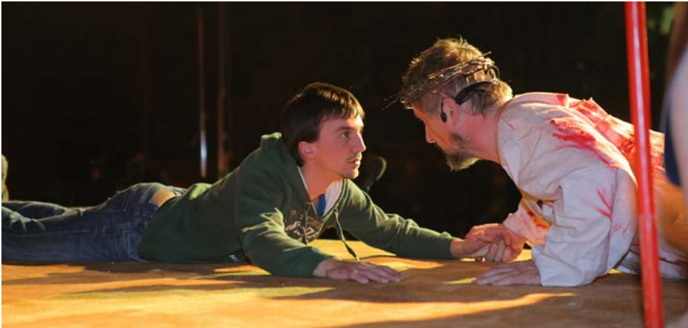
Ko se spogledata preteklost (Jezus) in sedanjost (Adam).

odveže grehov. Prerajeni Adam zapoje hvalnico in konča v Jezusovem objemu usmiljenja.