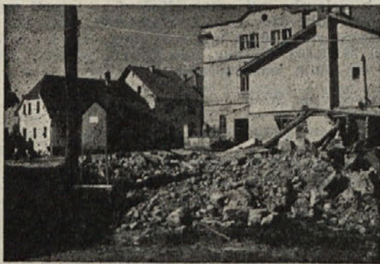
Tudi na Roški cesti v Kočevju se staro umika novemu...