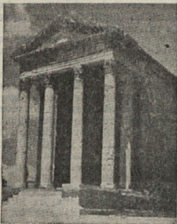
Bizantinski mavzolej (6. st.)