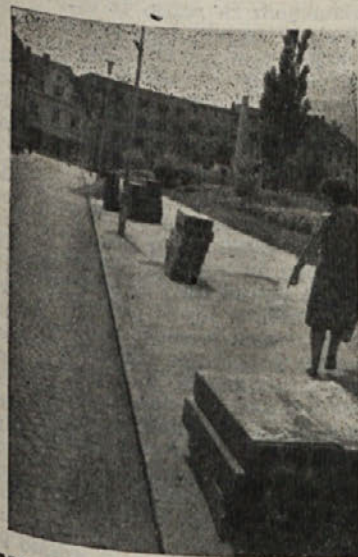
MESTNE MREŽE ZA NOVO TELEFONSKO OMREŽJE. Z dograditvijo nove pošte se bo močno povečala tudi telefonska mreža v Kočevju, ki bo omogočala večje število telefonskih števil. Dela pri polaganju kablov izvajajo delavci podjetja Tegrad iz Ljubljane. Na sliki: Samo še malo in kablji bodo položeni v zemljo

(V.P.) Turistični in krajevni predstavniki se posvetujejo s predstavniki cestnega podjetja o asfaltiranju vaške poti skozi naselje. Ortnek, ki bo v slučaju okvare magistrale na relaciji Ortnek tudi pomožna vezalna pot. Sredstva bo treba poiskati, zato naj priskočijo na pomoč vsi, ki so zainteresirani, tako turistično društvo, kmetijska zadruga, gozdno gospodarstvo, trgovsko podjetje »Hrana« in občina.