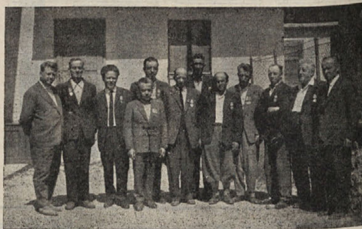
Ob krajevnem prazniku Loškega potoka so tudi podelili nekaterim bivšim borcev odlikovanja predsednika Tita

Potrebe po kompleksnem izobraževanju so vedno večje in prav gotovo bo kočevska delavska univerza lahko v prihodnji sezoni podvojila svoje delo. -ia